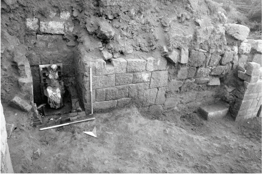
Fig. 4 Kybele'nin Niş (Naikos ) İçindeki Konumu ve Önde Yıkık Vaziyette Taşıyıcı Mimari Elemanlar.