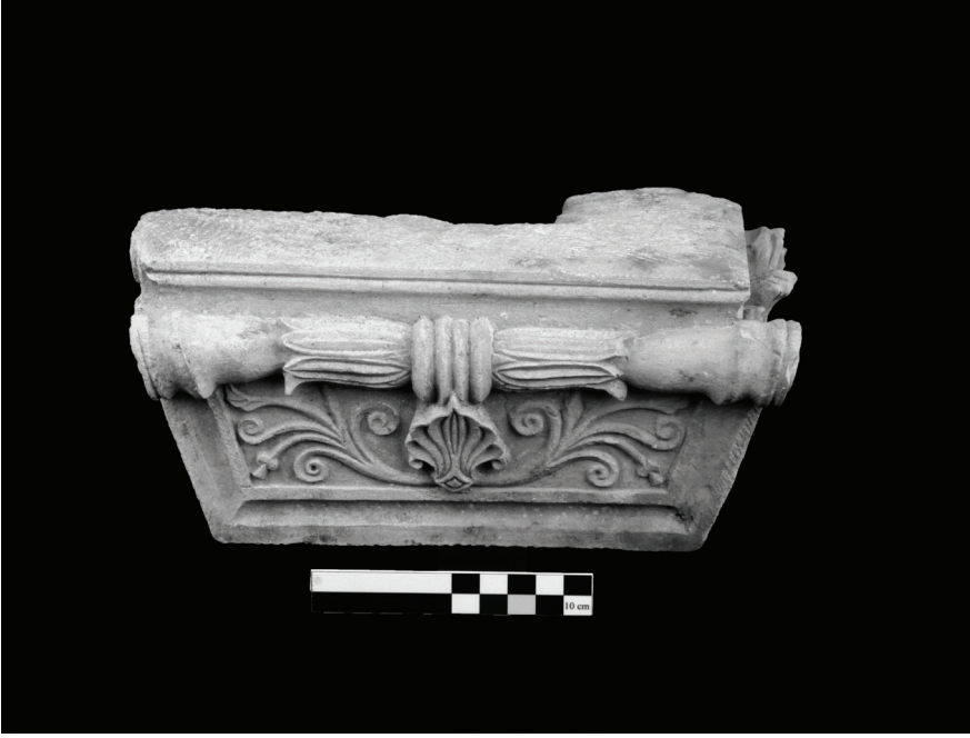
Fig. 12 Sađ Taraftaki Bařlıđın Uzun Kenarı.