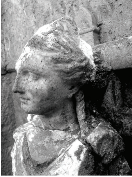
Fig. 8 Kybele'nin Başı.