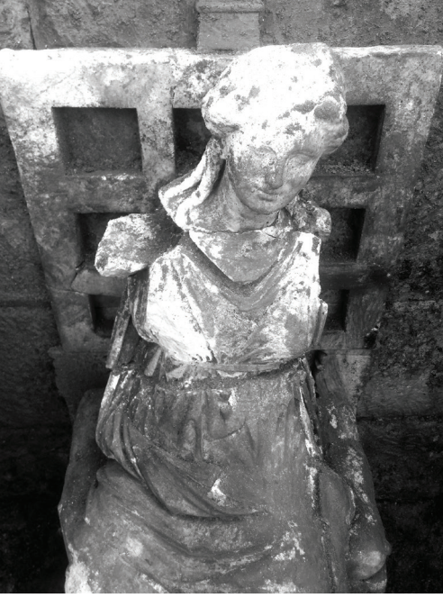
Fig. 6 Kybele'nin Üst Gövde Kısmı.