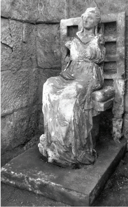
Fig. 7 Kybele'nin Soldan Görünümü.