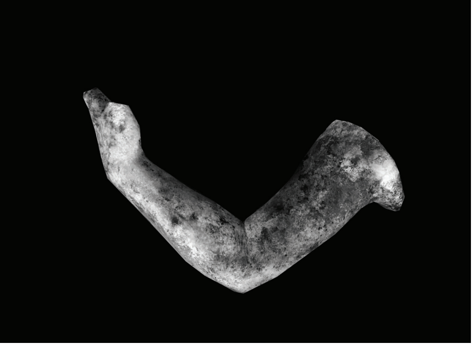
Fig. 10 Kybele'nin Sol Kolu.