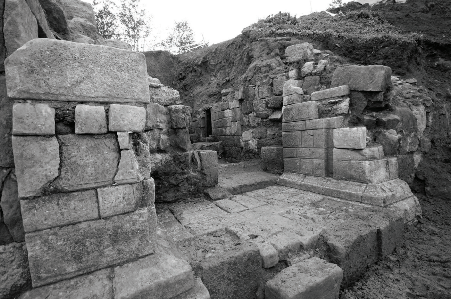
Fig. 3 Kurul kalesi Kapı Alanı ve Kybele'nin Bulunduğu Ana Kapının Duvar Örgüleri.