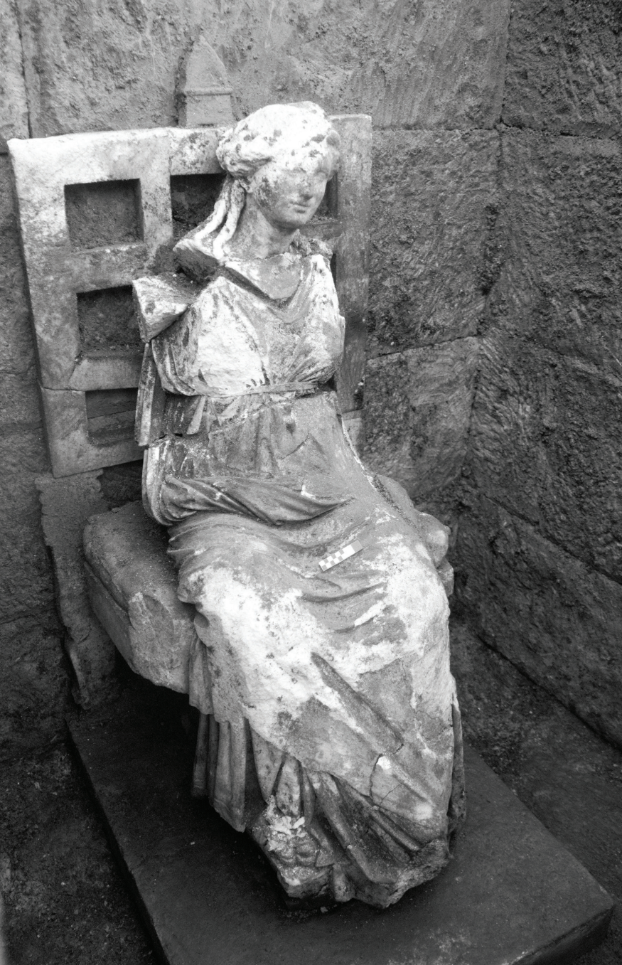
Fig. 5 Kybele'nin Sağdan Görünümü.