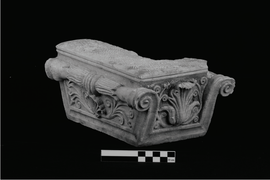
Fig. 13 Sađ Taraftaki Bařlıđın Kısa Kenarı.