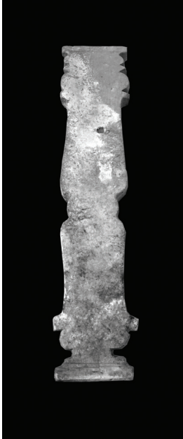
Fig. 11 Kybele'nin Tahtı'nın Arka Sol Bacağı.