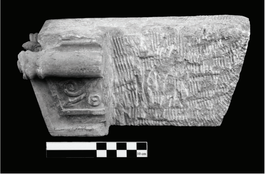
Fig. 14 Sağ Taraftaki Başlığın Diğer Uzun Kenarı.