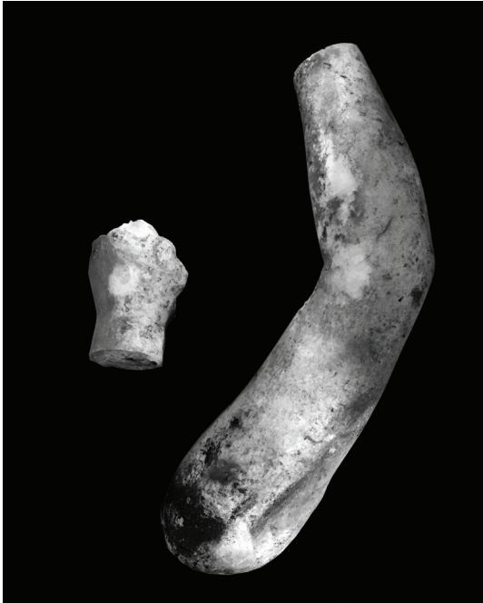
Fig. 9 Kybele'nin Sağ Kolu.