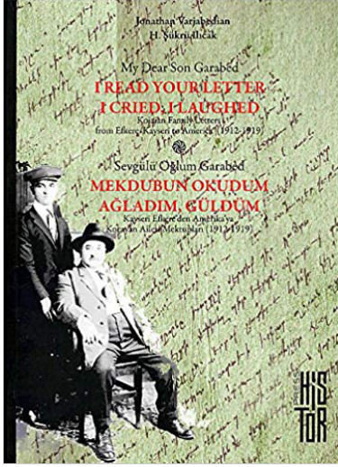
Şekil 3. 1912’de Kayseri – Efkere’den Detroit’te göç eden Kocayan aile fertlerinin Ermeni harfli ve Türk dilli mektuplaşmaları (İlıcak ve Varjabedian, 2018).

Araştırmacı Kevork Pamukciyan Ermeni Harfli Türkçe Metinler adlı eserinde, Vartan Paşa olarak tanınan Hovsep Vartanyan’ın (1813 – 1879) 1851 yılında Ermeni harfli Türkçe olarak kaleme aldığı Akabi Hikâyesi (Kostantiniyye : Mühendisioğlu Matbaası, 1851, 438 s.) adlı eseriyle “ bir Batı edebiyatı türü olan romanın Osmanlı İmparatorluğu sınırları içerisinde ilk kez ” denenmiş olduğu bilgisini verir (Pamukciyan, 2002, s. 20).