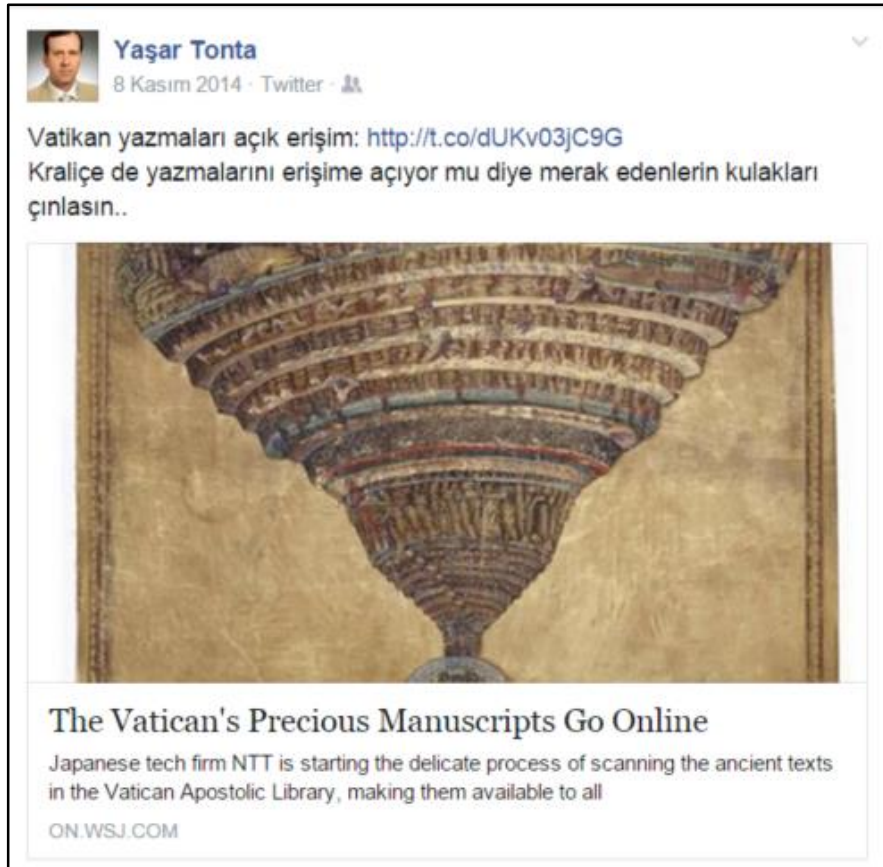
Şekil 1. Örnek 1'de gösterilen künyenin Facebook paylaşımı