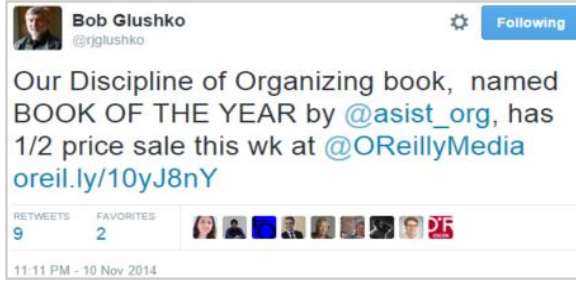
Şekil 3. Örnek 1'de gösterilen künyenin Tweet paylaşımı