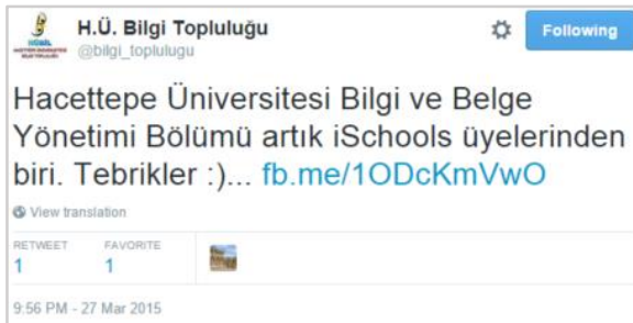
Şekil 5. Örnek 3'te gösterilen künyenin Tweet paylaşımı