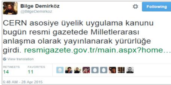
Şekil 4. Örnek 2'de gösterilen künyenin Tweet paylaşımı