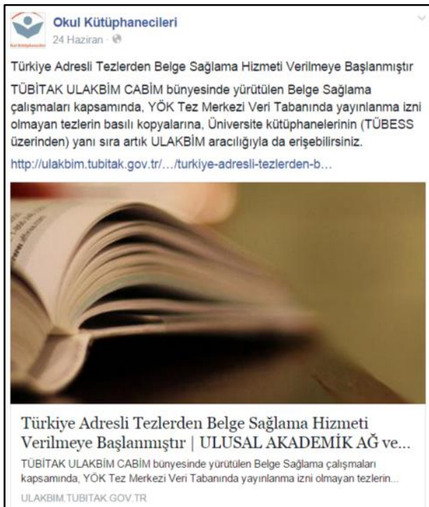
Şekil 2. Örnek 2'de gösterilen künyenin Facebook paylaşımı

Not: Facebook üzerinden paylaşılan video, fotoğraf ya da infografikler için yapılan tek değişiklik köşeli parantez içerisindeki açıklamanın paylaşımın türüne göre [Video], [Fotoğraf], [Infografik] şeklinde değiştirilmesidir.