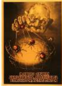
Resim 4. "Silah" Konulu Propaganda Posteri

Özellikle Naziler komünizm ideolojisi ile Yahudilerin yakın bir ilişkisi olduğunu iddia etmekteydi (Waddington, 2007, s. 573). Nazi propagandası, Yahudileri, İkinci Dünya Savaşı'na neden olmakla suçlamaktaydı (Herf, 2005, s. 51). Posterde de Yahudi tarafından kapitalizm ve komünizmin yönetilmesi, Müttefik Devletleri'nin Almanya'ya karşı mücadelesinde Yahudilerin rolü olduğu düşüncesini meydana getirilmektedir. Nitekim posterde doğrudan "Yahudiler, dünyayı masonluk, komünizm ve kapitalizm ile yönetmektedir" şeklinde propaganda miti inşa edilmektedir. Posterde bu üç kavramının kitlelerin zihinlerinde olumsuz bir şekilde yer edebilmesi için de kavramlar dünya çevresine ağ ören örümcekler olarak yansıtılmaktadır. Posterin koyu tonlarda resmedilmesi ile de posterdeki ürkütücülüğün artırılması amaçlanmaktadır. Yahudiler, kitleleri tahakküm altına aldıkları iddia edilen üç kavram ile birlikte posterde "koru" metaforu olarak kullanılmaktadır. Nazi propagandası, posterde kullandığı göstergeler üzerinden hem Yahudilere hem de komünizm ve kapitalizme karşı nefret söylemi inşa etmeye çalışmaktadır. Yahudilere yönelik oluşturulan nefretin doğrudan komünizm ve kapitalizme