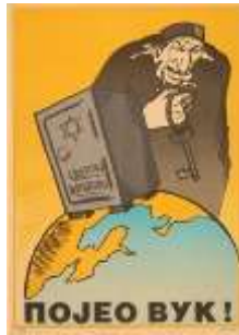
Resim 6. "Servet" Konulu Propaganda Posterleri

Poster yananlam açısından yorumlandığında, posterde Yahudilerin dünyanın ekonomik zenginliklerini sömürdükleri mesajının verildiği görülmektedir. Nitekim Yahudilerin, kriz döneminde ekonomik olarak iyi durumda olmaları, Yahudilere karşı olumsuz bir tutuma yol açabilmekteydi (Kohl, 2011, s. 8). Posterde resmedilen kasa görseli, sözde Yahudilerin dünya zenginliklerini sömürerek elde ettiği servetin simgesi olarak kullanılmaktadır. Böylece "Yahudiler, dünya ekonomisini elinde tutmaktadır" şeklinde propaganda miti inşa edilmektedir. Nitekim kasanın üzerinde bulunan altıgen yıldızda posterde verilen mesajı güçlendirmektedir. Posterde Yahudi'nin elinde bulunan anahtar görseli de Yahudilerin dünyadaki servetin idaresini ellerinde tuttuklarını simgelemektedir. Böylece Yahudiler, posterde "sömürü" metaforu olarak ön plana çıkarılmaktadır. Kasanın hemen yanında bulunan Yahudi'nin korkutucu resmedilmesi ile Sırp halkının Yahudilere yönelik ön yargı geliştirmesi amaçlanmaktadır. Naziler, Sırp lar ile birlikte dünya milletlerinin yaşadığı ekonomik sıkıntılarının temeli olarak Yahudileri göstermektedir. Nazi propagandası, Yahudilerin dünya halklarının emeklerini sömürerek zengin olduklarını ve halen zenginliklerin önemli bir bölümünü ellerinde bulduklarını aktarmaktadır. Böylece Naziler, ekonomik nedenlerden dolayı Sırp ların, Yahudilere karşı olumsuz bir algı geliştirmesini istemektedir.