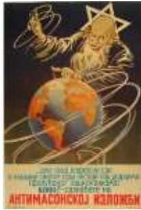
Resim 8. "Dünya" Konulu Propaganda Posterleri

Poster yananlam açısından yorumlandığında, posterde Yahudilerin dünya liderliğinin önlenmesi için Sırp milliyetçilerinin Yahudilere karşı harekete geçmesi gerektiğinin aktarıldığı görülmektedir. Yahudilerin egemenlik kurma ve tehdit oluşturma fikirleri, Nazi propagandası tarafından kullanılmaktaydı (Bytwerk, 2005, s. 37). Bu açıdan posterde "Milliyetçilik, Yahudilerin dünya egemenliğini sonlandırır" propaganda miti inşa edilmeye çalışılmaktadır. Yahudiler, "egemenlik" metaforu olarak posterde yansıtılmaktadır. Naziler, böylece işgal altında tuttukları diğer ülkelerde olduğu gibi Sırbistan'da da Yahudilere karşı milliyetçi güçlerin desteğini almaya çalışılmaktadır. Posterde dünya maketinin Yahudi tarafından çevrilmesi ile dünyanın yalnızca ekonomik değil idari anlamda da Yahudilerin denetimine geçme tehlikesi içerisinde olduğu aktarılmaktadır. Bu tehlikenin durdurulabilmesi için de milliyetçiliğin güç kazanması gerektiği vurgulanmaktadır. Nazi propagandası doğrudan Sırp halkının ekonomik alanda olduğu gibi idari alanda da Yahudileri ülke yönetiminden uzaklaştırmaları gerektiğini savunmuştur.