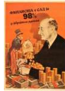
Resim 7. "ABD" Konulu Propaganda Posterleri

Yananlam bağlamında incelendiğinde, posterde Sam Amca'nın ABD'nin simgesi, Yahudi bankerin ise tüm Yahudilerin metonimi olarak ön plana çıkarıldığı görülmektedir. Naziler, Yahudi oluşturduğunu iddia ettikleri tehdidin ortadan kaldırılmasını amaçlamaktaydı (Warburg, 2010, s. 5). Antisemitizm, Yahudileri ekonominin dışında tutma sürecini de beraberinde getirmekteydi (Safrian, 2000, s. 390). Bu propaganda posterinde de Yahudilerin ekonomik anlamda oluşturduğu sözde tehdide vurgu yapılmaktadır. Böylece ABD'de bulunan zenginliklerin Yahudiler tarafından ele geçirildiği ve ABD'nin ekonomik gelirlerinin Yahudilere yönetildiği aktarılmaktadır. Posterde, çalışma kapsamında incelenen diğer posterlerin aksine sayısal veriden yararlanılmıştır. Buna karşın %98'lik oran, posterde herhangi bir kaynağa dayandırılmamıştır. Naziler, dünyanın en güçlü ekonomilerinden biri olan ABD ekonomisinin doğrudan Yahudilerin elinde bulunduğunu iddia etmesi ile ABD'de nüfus olarak sınırlı bir orana sahip olan Yahudi halkının, ülkedeki genel ekonomik yapıda ne kadar etkili olabildiğini aktarmaktadır. Yahudiler posterde "sömürü" metaforu olarak sunulmakta ve bu yolla Nazi propagandası "Yahudiler, ABD ekonomisini elinde tutmaktadır" şeklindeki miti inşa etmektedir. İnşa edilen propaganda miti ile Yahudilerin benzer bir etkiyi Sırbistan'da da oluşturabileceği belirtilmektedir. Bu süreçte Sırp ların,