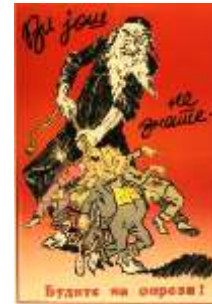
Resim 3. "Tehlike" Konulu Propaganda Posteri

Yananlam bağlamında incelendiğinde, posterde Yahudi'nin elindeki urgan, Sırp halkının ekonomik ve sosyal yönden sözde Yahudilerin esaretinde bulunmalarını simgelemektedir. Naziler, Yahudileri halkın yaşadığı sıkıntıların sorumlusu olarak ifade etmekteydi (Yourman, 1939, s. 159). Yahudi'nin Sırp halkına göre devasa boyutta gösterilmesi de Yahudilerin Sırp halkı üzerinde kurduğu tahakkümü temsil etmektedir. Posterde yer alan Sırp halkı, farklı sosyo-ekonomik sınıftan kişilerin metonimi olarak kullanılmaktadır. Posterdeki yazılı kodda da Sırp halkının Yahudilerin ne kadar tehlikeli olabileceklerini bilmedikleri aktarılmaktadır. Buna karşı posterdeki görsel kodlar üzerinden Sırp halkının ne kadar büyük bir tehlike ile yüz yüze kaldığı gösterilmeye çalışılmaktadır. Böylece posterde "Yahudiler, Sırp halkını esaret altına almaktadır" şeklinde propaganda miti inşa edilmeye çalışılmaktadır. Posterde Yahudiler, "tehlike" metaforu olarak ön plana çıkarılmaktadır. Nazizm'de Yahudi karşıtlığı kimi zaman olumsuz eylemlere yol açabilmekteydi (Voigtländer ve Voth, 2012, s. 1339). Posterde Sırp halkının Yahudiler tarafından zulme uğradığı şeklinde bir algı oluşturularak, Sırp halkının sözde Yahudi esaretine karşı harekete geçmesi amaçlanmaktadır.