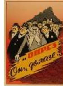
Resim 5. "Tehdit" Konulu Propaganda Posteri

Yahudilerin sayısının artması, Sırp halkı üzerinde kurdukları tahakkümün daha da güçleneceği algısını oluşturmaktadır. Bu da Sırp halkını, Yahudilerin sayısının artmasını engellemeye yöneltmektedir. Naziler Yahudileri "egemenlik" metaforu olarak aktarmakta ve böylece posterde "Yahudiler, Sırbistan'a egemen olmaktadır" propaganda miti inşa edilmektedir. İnşa edilen propaganda miti ile birlikte Yahudilerin, Sırbistan'ı ekonomik ve sosyal manada ele geçirecekleri mesajı verilmektedir. Nazi propagandası, posterde kullandığı yazılı koda "Onlar" şeklinde Yahudileri nitelendirmektedir. Böylece Naziler, Yahudilerin Sırbistan'ın bir parçası olmadığını aktarmakta, Sırları ve Yahudileri ayrı ayrı gruplar olarak değerlendirmektedir. Naziler, Yahudileri ötekileştiren ve dışlayan bir dil kullanarak, Sırların Yahudileri kendilerinden farklı ve tehlikeli bir grup olarak algılamalarını istemektedir. Nazilere göre Yahudilerin Sırbistan'da sayılarının artması, Sırlar için tehlikenin bir habercisi olarak sunulmaktadır. Böylece Sırların kendi