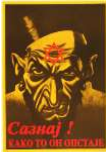
Resim 2. "Kötülük" Konulu Propaganda Posteri

Poster yananlam açısından yorumlandığında, posterde sözde Yahudilerin Sırp halkı için ne kadar büyük bir tehlike olduğu vurgulanmaya çalışılmaktadır. Nazi propagandası, Yahudileri komplo yapmakla suçlamaktaydı (Herf, 2006, s. 67; Bytwerk, 2015, s. 212). Diğer bir deyişle Yahudiler, büyük bir tehlike olarak sunulmaktaydı. Bu aşamada korkutucu şekilde resmedilen Yahudi görseli, posterde yer alan yazılı kod ile birlikte değerlendirildiğinde, Nazi propagandasının "Yahudiler, Sırbistan'da kötülüklerin kaynağıdır" şeklinde propaganda mitini meydana getirmeye çalıştığı ortaya çıkmaktadır. Naziler böylece Sırp halkının başlarına gelen savaş, yıkım, yokluk vb. tüm olumsuzlukların kaynağı olarak Yahudileri görmelerini istemektedir. Bu amaçla posterde resmedilen korkutucu Yahudi temsili, Sırp halkının zihinlerinde yer etmesini istedikleri Yahudi stereotipini oluşturmaktadır. Posterdeki yazılı kodun cevabı, doğrudan kitlelere sunulan Yahudi stereotipi üzerinden verilmeye çalışılmaktadır. Naziler, böylece Yahudiler denildiğinde Sırp halkının zihinlerinde doğrudan temsil edilen Yahudi stereotipinin kötülük metaforu olarak ön plana çıkmasını amaçlamaktadır. Posterde yer alan Yahudi temsiline, tüm Yahudilerin metonimi olarak kullanılması ile algının tüm Yahudiler için geçerli olmasına çalışılmaktadır. Böylece Naziler, Yahudilere karşı girişmiş