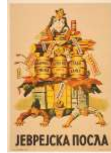
Resim 1. "Alışveriş" Konulu Propaganda Posterleri

"Alışveriş" konulu propaganda posterleri düzenlem boyutunda ele alındığında, posterde Yahudi bir bankerin Sırbistan'da bulunan temel ihtiyaç ürünlerinin üzerinde oturduğu görülmektedir. Kişinin Yahudi olduğu, üzerinden bulunan altıgen yıldızdan ve yüzündeki görsel kodlardan anlaşılmaktadır. Nazi propaganda çizimlerinde Yahudiler, genelde iri burunlu, sivri kulaklı ve geniş dudaklı olarak temsil edilmektedir. İhtiyaç ürünlerinin hemen altında da görsel kodlar içerisinde farklı sosyo-ekonomik sınıftan Sırp vatandaşlarının ezilmekte olduğu yansıtılmaktadır. Posterde Yahudi banker keyifli olarak belirtilirken, Sırp vatandaşları ise acı çekerken aktarılmaktadır. Posterin altında ise "Yahudi Alışverişi" yazılı kodu bulunmaktadır.