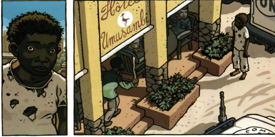
Resim 2: (Stassen, 2000: 2)

Eserin hemen başında Déogratias’ın yırtık, kirli elbiseler içerisinde hırpani bir figür olarak okurun karşısına çıktığı görülür.