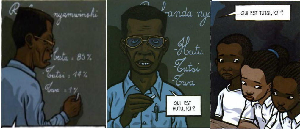
Resim 3: (Stassen, 2000: 19) Resim 4: (Stassen, 2000: 20) Resim 5: (Stassen, 2000: 20)

Öğretmen çocuklardan aldığı cevapların ardından Hutularıöverken Tutsi ve Twaları yeren bir konuşma yapar: