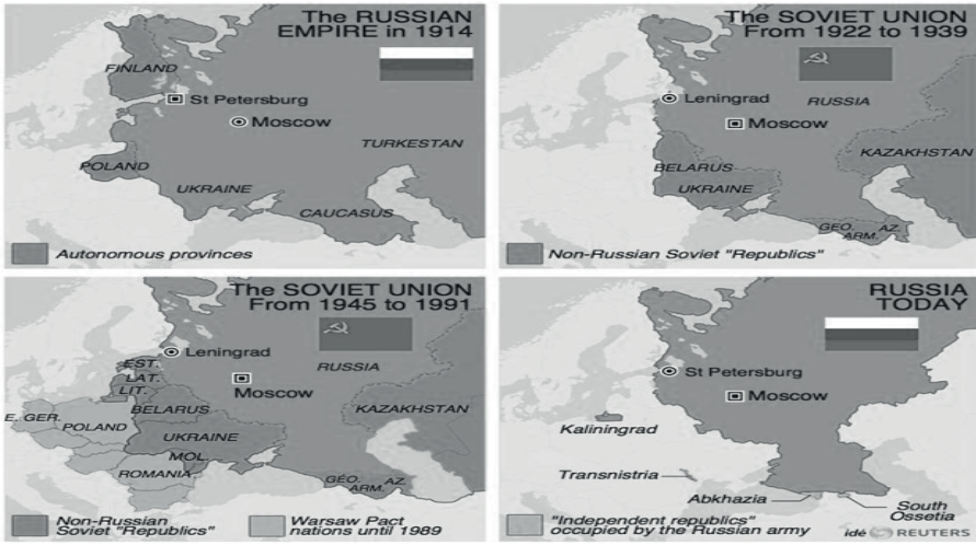
Harita I: 1914'ten Günümüze Rus Toprakları

ülke büyük bir geçiş dönemi yaşamıştır. Bir önceki başlıkta, Tablo II'de görüldüğü gibi 1945-1991 yılları arasında geçen dönemde Amerika Birleşik Devletleri ve Sovyetler Birliği'nin hegemonya mücadelesi tek tarafın galibiyeti ile sona ermiş ve sistemde mağlup bir Rus devleti ortaya çıkmıştır. Ancak Rusların kayıpları sadece duygusal olmamış, dünyanın en büyük kara coğrafyasına sahip olan bu devlet aynı zamanda çözülme ile büyük bir coğrafi kayıp da yaşamıştır (Bkz Harita I). Ukrayna'da teknolojik yatırımlarının yanı sıra tarım alanları, Azerbaycan ve Orta Asya'daki petrol ve doğal gaz kaynakları da kaybedilmiştir. Ayrıca imparatorluk döneminden itibaren baskın güç olan Rus halkı kaybedilen topraklarda, ikinci sınıf bir konumda kendinden ayrılan halkların kurduğu bağımsız ve yabancı devletler içinde yaşamaya başlamıştır (Tuminez, 2000).