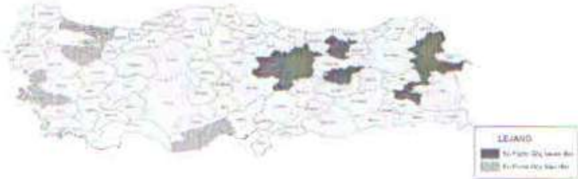
Harita 1: 1975-1980 yılları arasında en fazla göç alan ve en fazla göç veren illerin dağılımı.

Bu dönemde en fazla göç veren iller Kars(%11,3), Tunceli(%9,3), Gümüşhane(%8,6), Bitlis(%8,1), Ağrı(%8,0) ve Sivas(%7,5) iken, en fazla göç alan iller Kocaeli(%11,2), İzmir(%7,3), İstanbul(%7,3), Bursa(%6,1) ve İçel(%5,7)'dir 17 . En fazla göç Doğu Anadolu ve İç Anadolu Bölgesinden çıkmakta, göçün yönü en fazla Marmara Bölgesi'ne doğru olmaktadır.