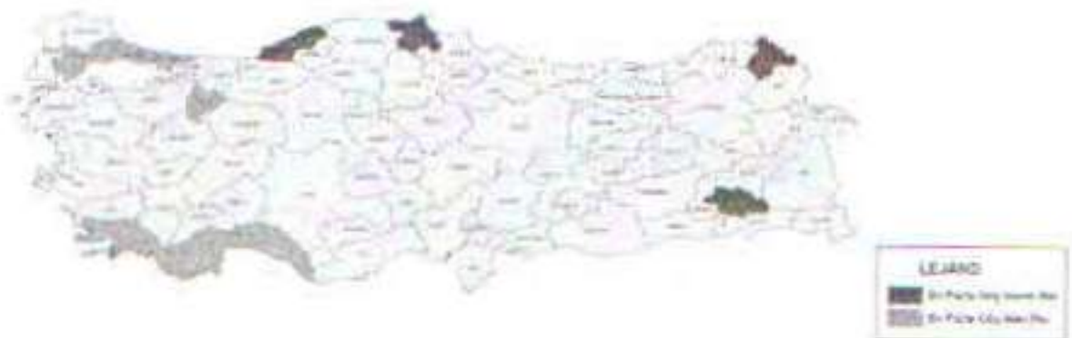
Harita 4: 1995-2000 yılları arasında en fazla göç alan ve en fazla göç veren illerin dağılımı

Bu dönemde en fazla göç veren iller Ardahan(%10,6), Bartın(%8,6), Sinop (%7,5), Siirt (%7,5) ve Zonguldak (%7,3) iken, en fazla göç alan iller Tekirdağ (%9,6), Muğla (%7,0), Antalya (%6,4), Bilecik (%5,7) ve İstanbul (%4,6)'dur 20 . En fazla göç Karadeniz Bölgesi'nden çıkmakta, göçün yönü en fazla Marmara ve Akdeniz Bölgesi'ne doğru olmaktadır. Bu dönem içinde 1975'ten 1990 yılına kadar sürekli en fazla göç veren iller arasında yer alan Kars ili bulunmamaktadır. Bunun en belirgin sebebi, Ardahan'ın 1992 yılında Kars'tan ayrılarak il statüsüne geçmiş olmasıdır. Eş deyişle, 1975-1990 yılları arasında Kars'tan çıkan nüfus, Kars iline bağlı Ardahan'dan göç etmektedir.