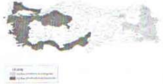
Harita 6: 1990-1995 yılları arasında kişi başına düşen GSYİH durumu.