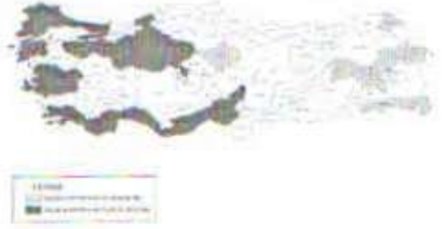
Harita 8: 2001 yılında kişi başına düşen GSYİH durumu.

Kişi başına düşen Gayri Safi Yurt İçi Hâsıla 1987-2001 yılları arasında beklenildiği üzere doğu illerinde daha az, batı illerinde daha yüksektir. Bölgeler arası dengesizliğin ekonomik yönü bu şemalardan okunabilmektedir.