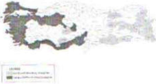
Harita 5: 1987-1990 yılları arasında kişi başına düşen GSYİH durumu.

Türkiye İstatistik Kurumu'ndan edinilen kişi başına düşen GSYİH dönemleri 1987-1990, 1990-1995, 1995-2000 ve 2001 yılları olarak ele alınmıştır. Her dönem için kişi başına düşen GSYİH en az ve en fazla alan iller gösterilmiştir.