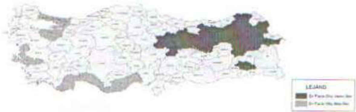
Harita 3: 1985-1990 yılları arasında en fazla göç alan ve en fazla göç veren illerin dağılımı