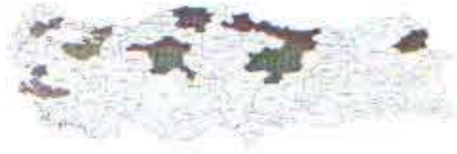
Harita 11: 1985-1990 yılları arası İstanbul göç durumu