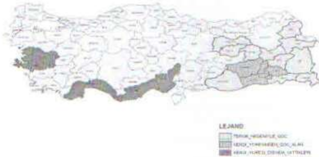
Harita 9: Doğu ve Güneydoğu Anadolu bölgelerinde terörden kaynaklı göçün illere dağılımı

Doğu ve Güneydoğu Anadolu Bölgeleri'nde terör kaynaklı zorunlu göç etme durumu 1983 yılından önce %7 düzeyinde iken; 1983-1990 yılları arasında %64,5'e yükselmiş ve bu artış 1993 yılına kadar sürerek %83,4'e ulaşmıştır. 1994 yılından itibaren ise terörden kaynaklanan zorunlu göç oranı azalmaya başlamış, 1997 yılında %28'e düşmüştür.