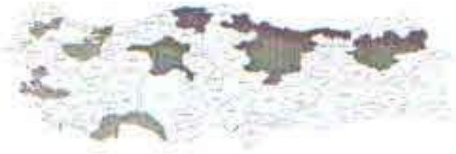
Harita 10: 1980-1985 yılları arası İstanbul göç durumu