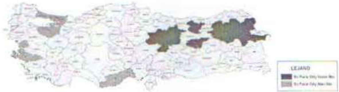
Harita 2: 1980-1985 yılları arasında en fazla göç alan ve en fazla göç veren illerin dağılımı

Bu dönemde en fazla göç veren iller Tunceli(%12,3), Kars(%7,7), Erzurum(%6,4), Sivas(%5,4), Gümüşhane(%5,4) ve Ağrı(%5,3) iken, en fazla göç alan iller Kocaeli(%6,7), İstanbul(%6,0), İçel(%5,6), İzmir(%4,1) ve Bursa(%4,1)'dir 18 . En fazla göç Doğu Anadolu Bölgesi'nden çıkmakta; göçün yönü en fazla Marmara Bölgesi'ne doğru olmaktadır.