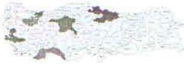
Harita 12: 1995-2000 yılları arası İstanbul göç durumu