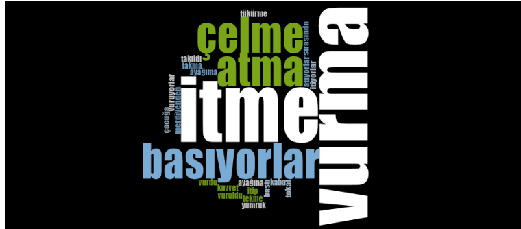
Görsel 4. Öğrenciye uygulanan fiziksel zorbalık çeşitlerine ilişkin öğretmen görüşleri

“ Mesela şimdi geldi ayağına bastı dedi. Çocuğa tekme atıyorlar. Ayağına basıyorlar. ” (Ö25)