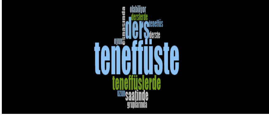
Görsel 6. Öğretmenlerin akran zorbalığının gözlemlendiği zamanlara ilişkin görüşleri