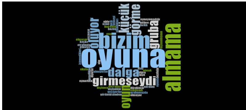
Görsel 3. Öğrenciye uygulanan sosyal zorbalık çeşitlerine ilişkin öğretmen görüşleri