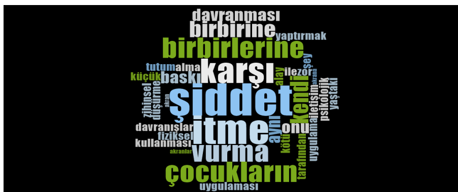
Görsel 1. Öğretmenlerin akran zorbalığı kavramına ilişkin çağrışımları

“Küçümseme, onu sınıf içinde yapma zor durumda bırakma” (Ö28) ifadesinde olduğu gibi öğretmenlerin altısı akran zorbalığını “küçümsemek” kavramı ile bağdaştırmışlardır.