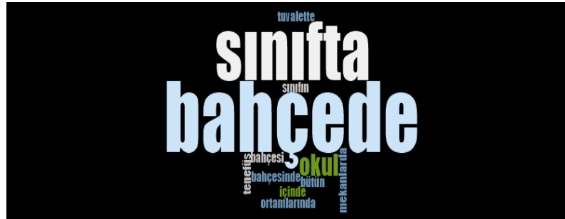
Görsel 5. Öğretmenlerin akran zorbalığının gözlendiği ortamlara ilişkin görüşleri

Görüşülen öğretmenlerden 11’i, “ İsim takılması okul bahçesinde olmuş. ” (Ö2) ifadesinde olduğu gibi akran zorbalığının bahçede gerçekleştiğini, 10’u “ ...teneffüslerde sınıfın içinde ” (Ö29) ifadesindeki sınıfta uygulandığı dile getirmiş, öğretmenlerden biri (Ö23) özellikle kız öğrencilerin tuvalette akran zorbalığı uyguladıklarını “ Teneffüs ile öğretmenin derse girdiği süreç içerisinde kızlar en çok tuvalette kavga ediyorlar. ” şeklinde ifade etmiştir.