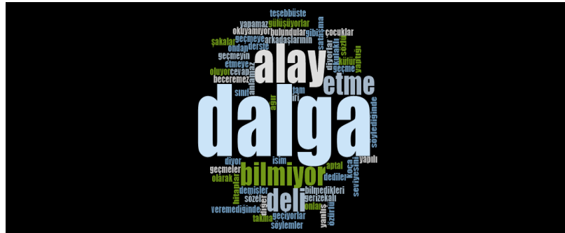
Görsel 2. Öğrenciye uygulanan sözel zorbalık çeşitlerine ilişkin öğretmen görüşleri

Yapılan görüşmelerde öğretmenler, normal gelişim gösteren öğrencilerin zihin yetersizliği olan öğrenciye; “ geri zekâlı ” (Ö25), “ deli ” (Ö21; Ö30), “ özürlü ” (Ö16) ve “ aptal ” (Ö9; Ö16) şeklinde isimler taktıklarını belirtmişlerdir.