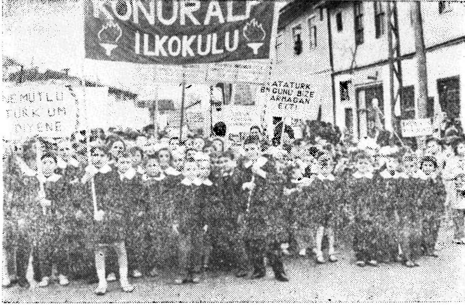
M.Z.K. "Salnamesinde bahsettiđi ve kendisine soyadı olarak seçtiđi kazasında Konrapa adını taşıyan İlktepede öğrencileri.

olan beyaz soyun haricinde bırakmak istemişlerse de bu telakkinin ilmi esasa istinat etmediđi, Türklerin sarı cinsten azma, deđil, belki beyaz ırkın babaları ve dünyanın ilk insanları olduđu, son ilmi tedkikat ile anlaşılımdır. Gerçekten eski Türklerin vatanı olan Orta Asya, yani Turan , umumiyetle kabul edildiđine göre beşeriyetin mehdi zuhuru idi. Avrupalıların babaları olan akvami âriye Pamir yaylasının cenubundan, akvami Turaniyye de şimalden neşet etmiş, Sark ve Garb için yeni zamanlara kadar menşe- mühaceret olmuş idi. Tarihin başlangıcında Turan'ın garbindeki arazi gayri meskun, şarkındaki arazi ise merkezi Çin olan sarı ırkla, merkezi Orta Asya olan beyaz ırk arasında müşterek idi. E. Reclus 'un "Umumi Coğrafya" sında söylediđi gibi Asyanın en yüksek mahalli olan Tulan Yaylaları, tedricen kurumađa başlayınca... Turanî akvamın Şarka akına başlamıştı... İranlıların Turan'ların İskit'lerin, kendi tabirlerince Saka'ların Orta Asya bozkırlarından Garbe, Garbi-Cenubiye doğru göçleri pek eski, takriben 3400, hatta 4000 sene evvel idi..."