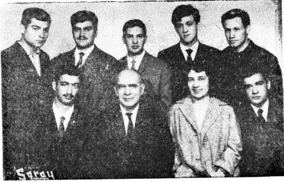
S. S. A. M. Üyelerinden Bir Grup