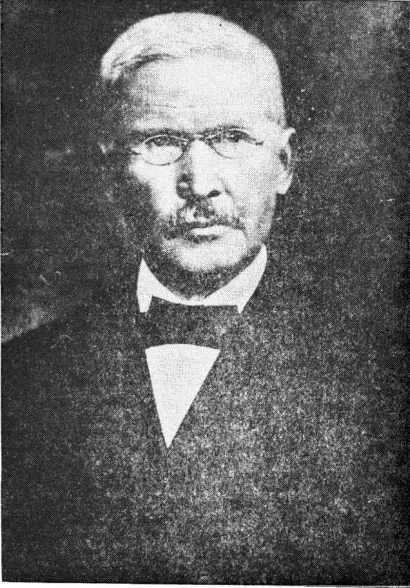
Alman ve dolayısıyla Dünya Z.K.K. nin Kurucusu W. Reiffeisen