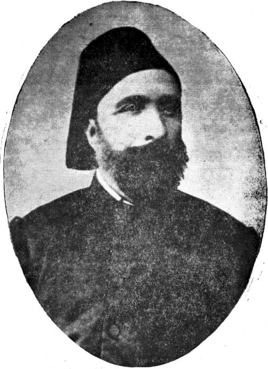
Türk Kooperatifeiliğinin Kurucusu Midhat Paşa