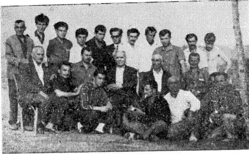
S.S.A.M. Azaları Balıkçılık Kooperatifleri kuruluşuna muhtaç olan Karasu Sahillerinde...