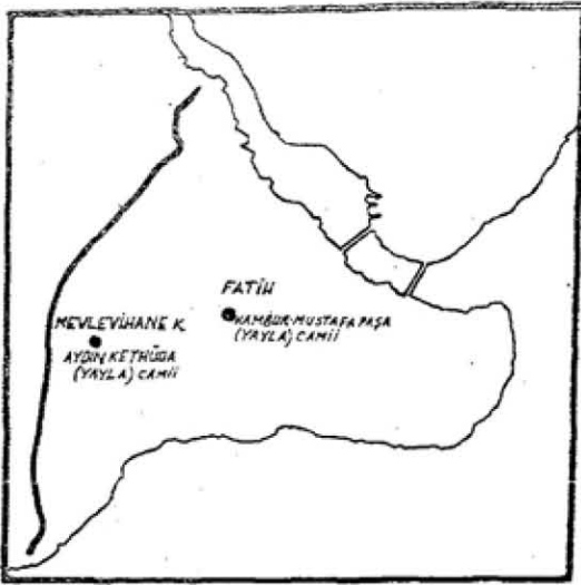
Res. 4 — İki Yayla camii'nin yerlerini gösteren kroki