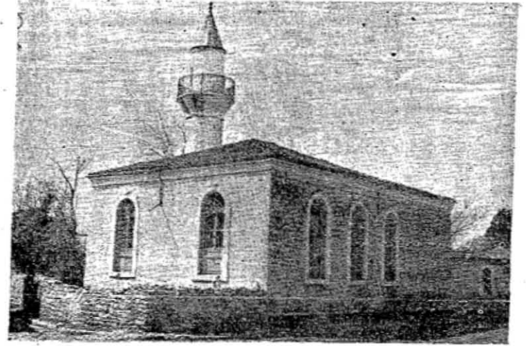
Res. 2 — Mevlavihane kapısındaki Yayla cami'i (1954)