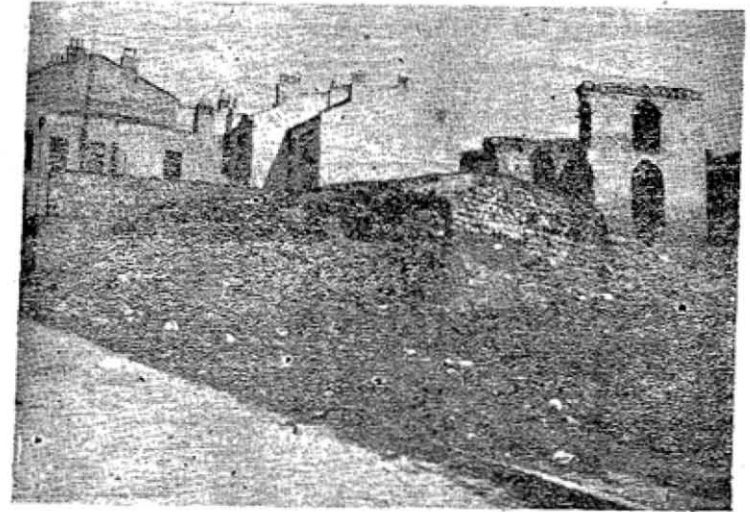
Res. 3 — Fatih'deki Yayla cami'i (1943)