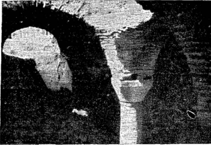
Res. 5 — Fatih'deki Yayla camii'nin altındaki sarnıcın içi (1948)