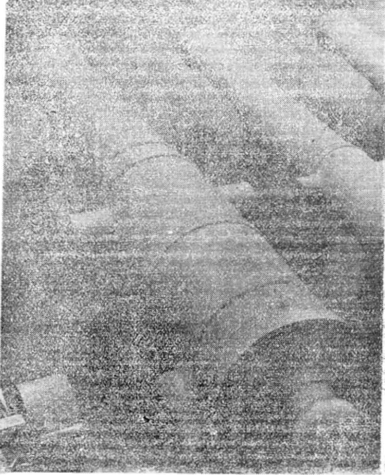
III. Selim'in tuğrasını hâvi top