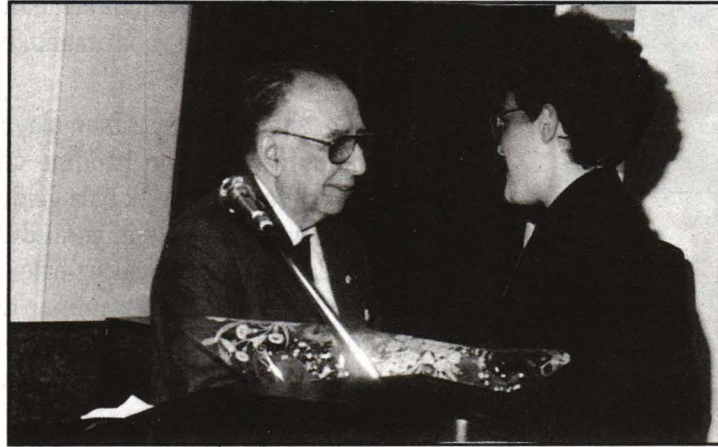
İ.T.Ü. Vakfı turizm ve otelcilik eğitimini birincilikle bitiren kursiyer sertifikasını alırken...

İki geçtiğimiz yıl çıkarılan Turizm Endüstrisi'93 kataloğu çıktı. Ekin Yazım Merkezi tarafından hazırlanan katalog, turizm sektörüne yönelik üretim yapan kuruluşların tanıtımlarını yapmakta ve katalog içerisinde her ürün çeşiti ayrı bir bölümde yer almaktadır. □