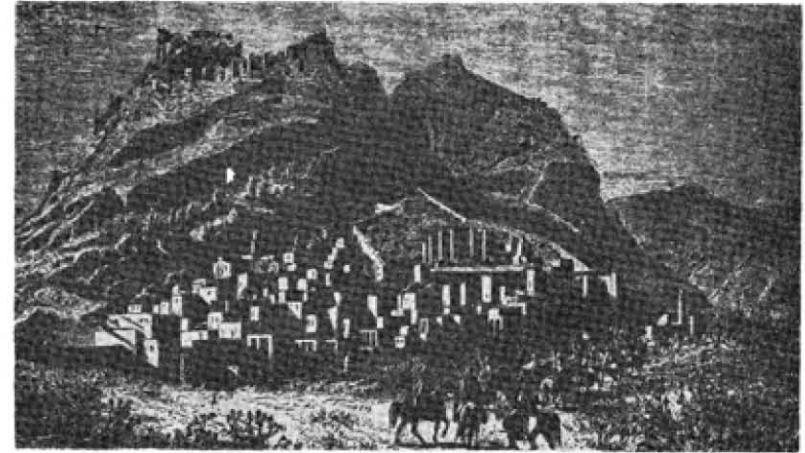
XIX. yüzyılda Kozan ve kalesi.