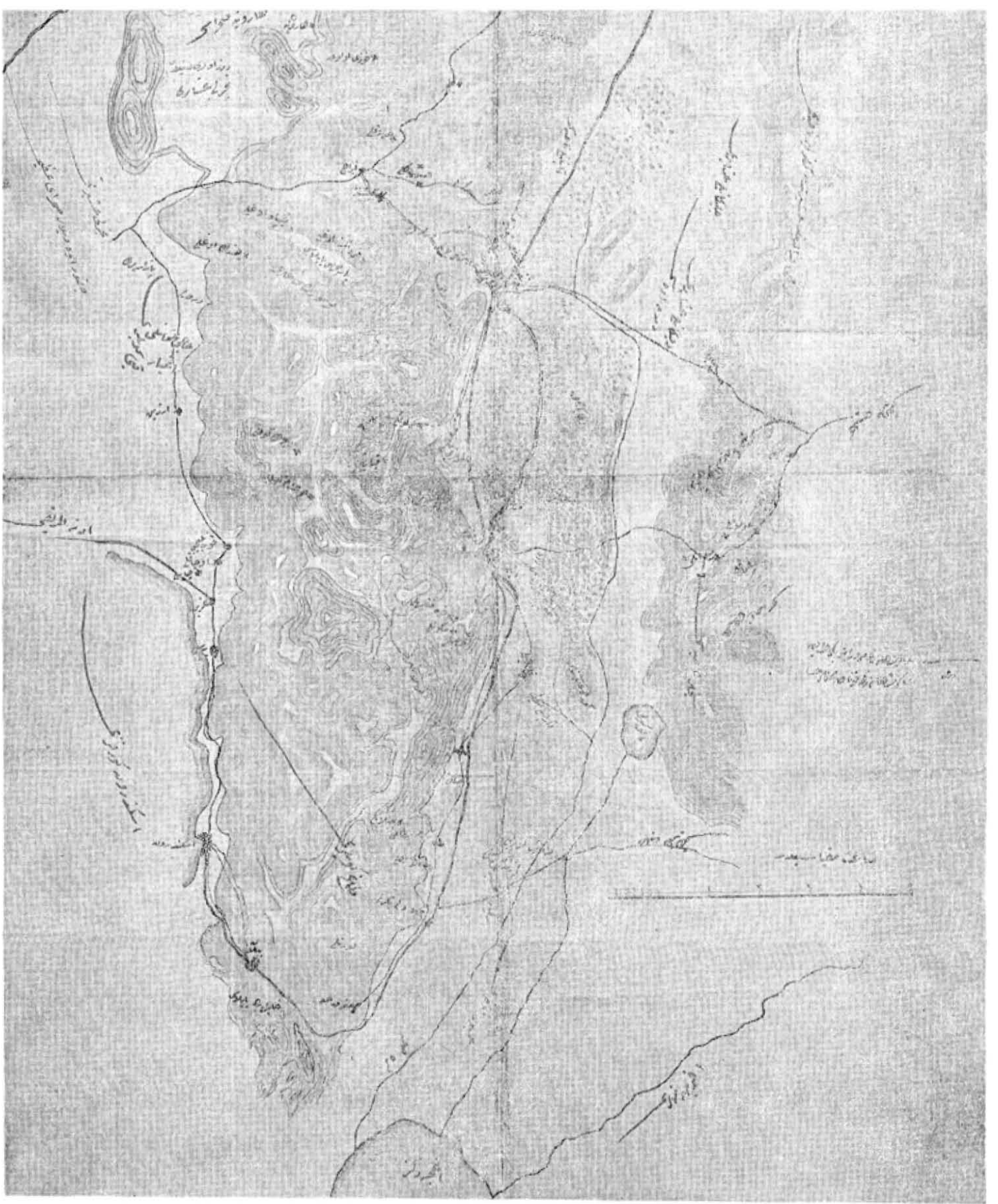
Fırka-i İslâhiye'nin takip ettiği yollar.