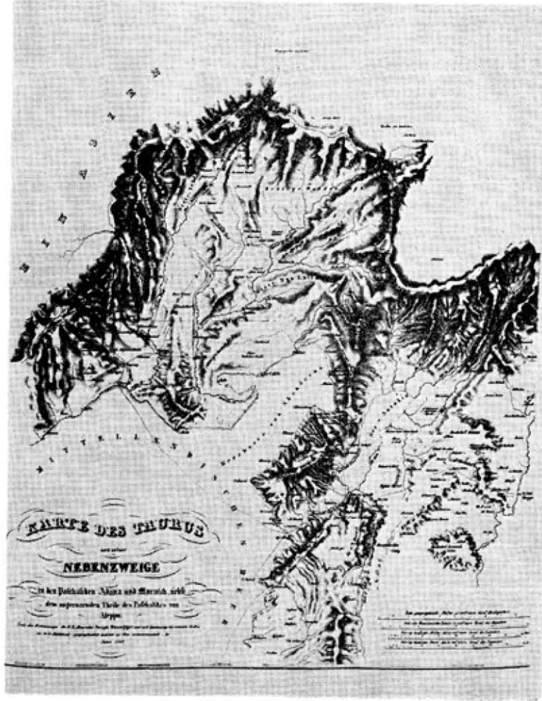
XIX. yüzyılda Kozan, İskenderun ve Antakya.