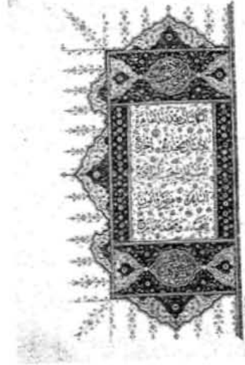
957/1540 tarihli Hurrem Sultan Vakfıyesi'nin tezhipi ilk iki sahife (TİEM 2191)