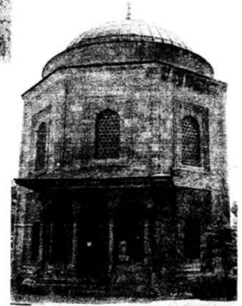
Hurrem Sultan'ın Türbesi (C. Nemlioğlu)