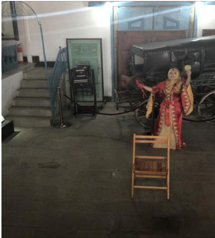
Resim 6. Yozgat’ın Düğün Gelenekleri Etkinliği

Öğrencilere eserleri incelemeleri için süre verilir. Odada bulunan eserler rehber tarafından tanıtılır. Günümüzde kullanılan eşyalar ile karşılaştırmaları sağlanır. Yozgat’ın düğün gelenekleri hatırlatılır. Günümüzde yapılan düğünler hakkında konuşmaları ve karşılaştırma yapmaları sağlanır. Öğrenciler Aynalı Körük’ün bulunduğu üst kat hole alınarak Yozgat yöresine ait, kına yakma, baş övme, kuşak bağlama geleneği canlandırılır. Bindallı kıyafeti giymiş olan öğretmen adayı gelin rolünü canlandırır. Aynalı Körük türküsü ile öğrencilerin oynayarak eğlenmeleri sağlanır.