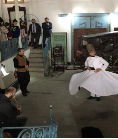
Resim 3. Semazen Etkinliği

Öğrencilere eserleri incelemeleri için süre verilir. Odada bulunan eserler rehber tarafından tanıtılır. Öğrenciler Aynalı Körük’ün bulunduğu üst kat hole alınarak ney eşliğinde semazen gösterisini izlemeleri sağlanır.