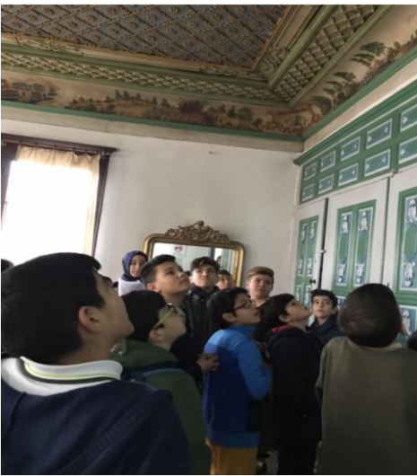
Resim 4. Tavan Resimlerinin İncelenmesi

Öğrencilerin odadaki eşyaları, tavan resimlerini incelemeleri için süre verilir. Tavanda yer alan şehir manzaraları, Çamlık manzarası (orman), savaş, Yozgat’ta çıkan büyük yangın, Hz İsa’ya dair anlatılan bir mucize hikâyesi ve av sahnelerini gösteren resimler incelenerek rehber tarafından açıklanır. Yapılan inceleme ve açıklamalardan hareketle belirlenen resimlerin öğrenciler tarafından canlandırılmaları sağlanır. Donuk imge oluşturmaları, duygu ve düşüncelerini açıklamaları sağlanır. Donuk imge tekniği katılımcıların yaşamdan bir anı hareketsiz bir biçimde göstermesidir. Bu teknikte tarihi bir nesne, donmuş bir film karesi, fotoğraflar, reklamlar, heykeller, kitap kapakları, posterler malzeme olarak kullanılabilir (Karadeniz ve Okvuran, 2014, s. 874).