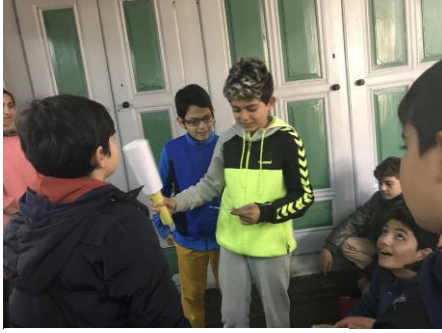
Resim 5. Şifa Tokmağı Etkinliği

Öğrencilere eserleri incelemeleri için süre verilir. Bu odada eskiden kullanılan savaş malzemeleri olan tüfekler, tabancalar, kılıçlar vb. rehber tarafından tanıtılır. Günümüzde kullanılan savaş malzemeleri ile karşılaştırmaları sağlanır. Milli Mücadele döneminden kahramanlık öyküleri anlatılır. Savaş ve Türk halkı sahnesinin olduğu resimler inceletilerek “Donuk İmge” tekniği ile empati etkinliği gerçekleştirilir. Odada bulunan “Şifa Tokmağı” tanıtılır, kullanım amacı ve şekli açıklanır. Atık malzemeden yapılmış şifa tokmağı öğrencilere verilerek hasta ve şifacı rollerini üstelenmeleri ve canlandırma yapmaları sağlanır.