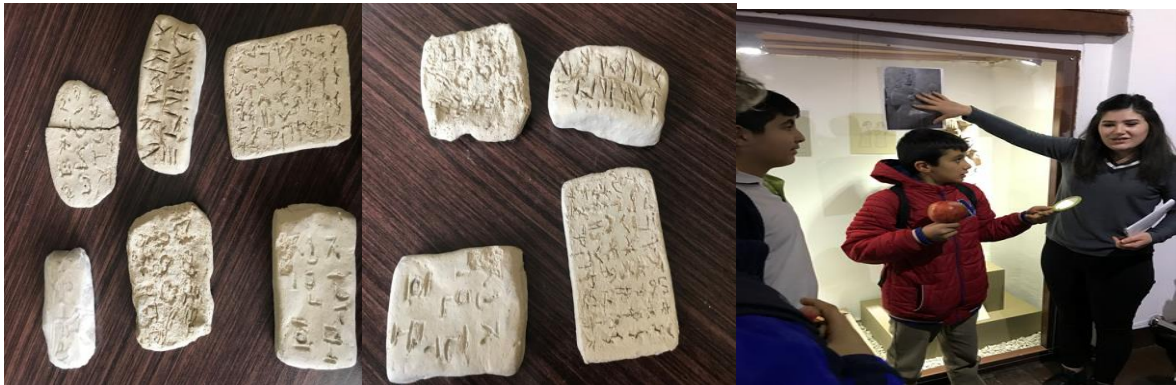
Resim 2. Kil Tablet ve Kubaba Etkinliği

Öğrencilere eserleri incelemeleri için süre verilir. Salonda bulunan heykel, figür, testi ve kaplar hakkında rehber tarafından bilgi verilir. Öğrencilerin sağ elinde nar, sol elinde ayna olan yönetici heykelini (Kubaba) incelemeleri, nar ve aynanın anlamı hakkında fikir üretmeleri sağlanır. Öğrencilere nar ve ayna verilerek heykeli canlandırmaları, o dönemde yaşadığını hayal ederek halka bir konuşma yapmaları sağlanır. Öğrencilerden salonda bulunan eserlerden birini seçerek kil-seramik veya oyun hamuru ile yapması sağlanır.