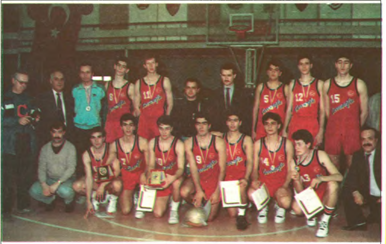
DÜNYA ŞAMPİYONU ÇAVUŞOĞLU LİSESİ

Çavuşoğlu Şirketler Grubu Genel Müdürü Ahmet ÇAVUŞOĞLU'nun enjin spor sevgisi ve öncülüğünde, spor alanlarında elele, düzenli ve disiplinli çalışmalarla bu başarılı tabloya imza atan yönetim ve teknik kadroları da 4 yıldır aynı isimlerden oluşuyor. Ulaştığı üstün başarılarıyla uluslararası alanda Türkiye'nin sesini duyuran ve milletçe gurur kaynağımız olan Özel Çavuşoğlu