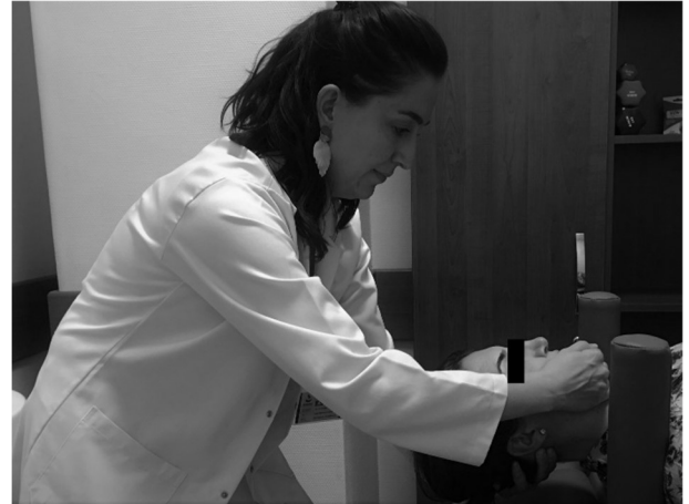
Şekil 2. Manuel traksiyon.