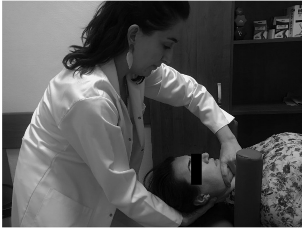
Şekil 4. Manuel traksiyon ile anterior-posterior gliding (kaydırma).