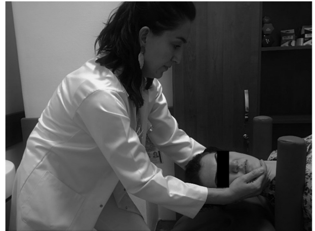
Şekil 3. Manuel traksiyon ile rotasyon