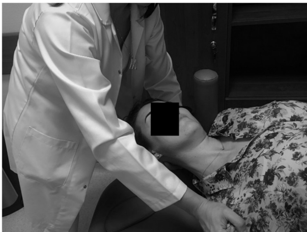
Şekil 6. Trapez kası manuel germe.

çalışmada, elastografi kullanılmış ve kasların sertliğinin değerlendirilmesinde kullanılabilir bir yöntem olduğu sonucuna varılmıştır. 16