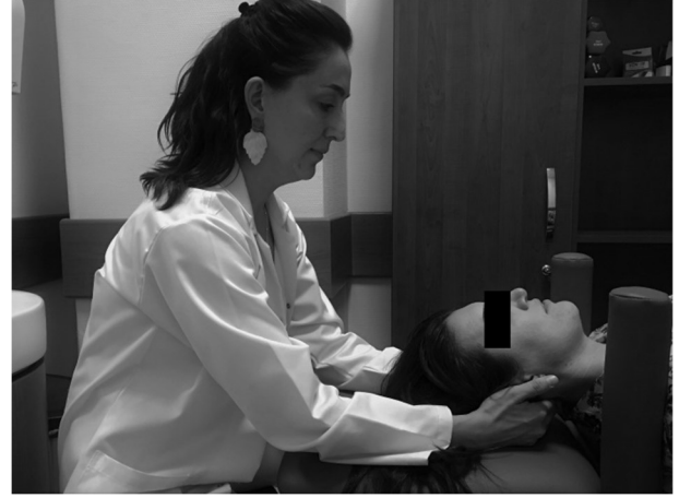
Şekil 1. Bridging (köprü) tekniği.

Elastografi, dokunun mekanik özelliklerini kalitatif, görsel ya da kantitatif olarak değerlendiren ultrason temelli bir yöntemdir. 15 Yumuşak dokuların viskoelastik özelliklerinin görüntülenmesi, farklı mekanik özelliklerinin ya da patolojik lezyonların belirlenmesinde fayda sağlamaktadır. 15 Kronik boyun ağrılı hastalarda perikranial kasları değerlendiren bir