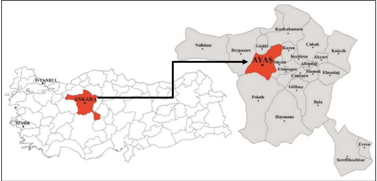
Şekil 2. Ayaş İlçesi'nin Türkiye ve Ankara'daki konumu.

Çalışma alanı, Ankara İli'ne bağlı Ayaş İlçesi'nin kentsel sit alanı ve etkileşim sahası sınırı içerisinde kalan bölgedir. Ankara'nın 58 km kuzeybatısında yer alan çalışma alanı, 1158 km 2 yüz ölçüme sahiptir. Doğusunda Sincan ve Kazan, batısında Beypazarı, kuzeyinde Güdül ve Kızılcahamam, güneyinde Polatlı ilçeleri bulunmaktadır (Şekil 2).