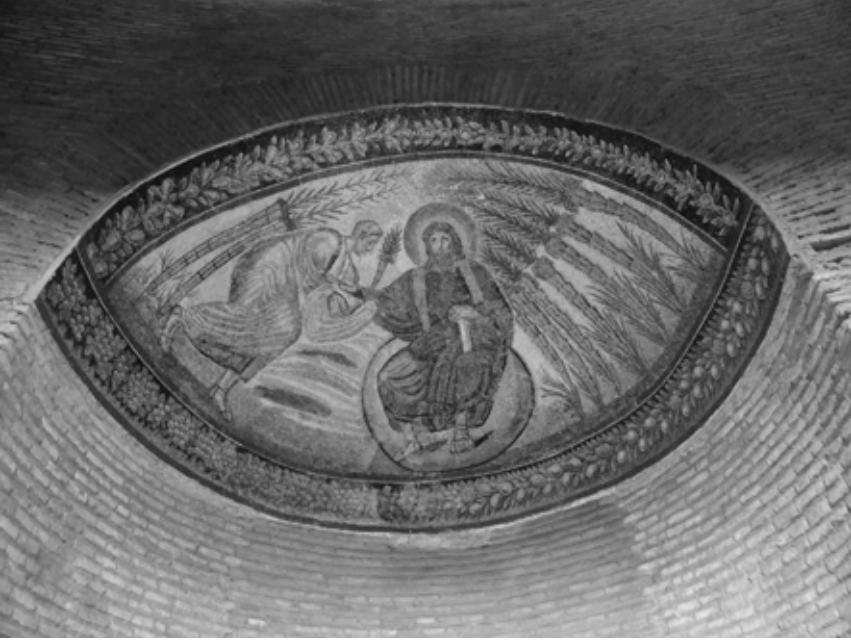
Hız. İsa Pantokrator, Roma: Sta. Constantia Mozole, M.S. 5. (veya 7.) Yüzyıl, (fotoğraf Nicole Kaçal-Ferrari).