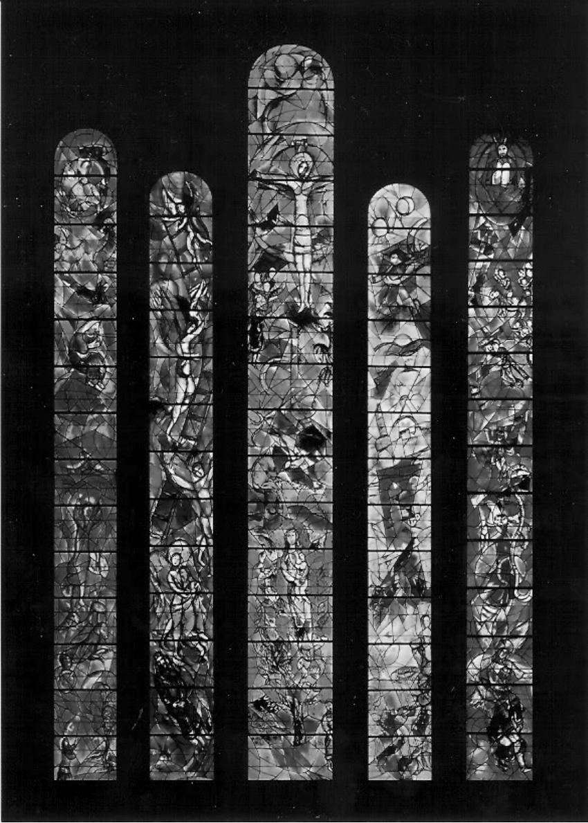
Vitray pencereler, Zürich: Fraumünsterkirche, Marc Chagall, 1970.