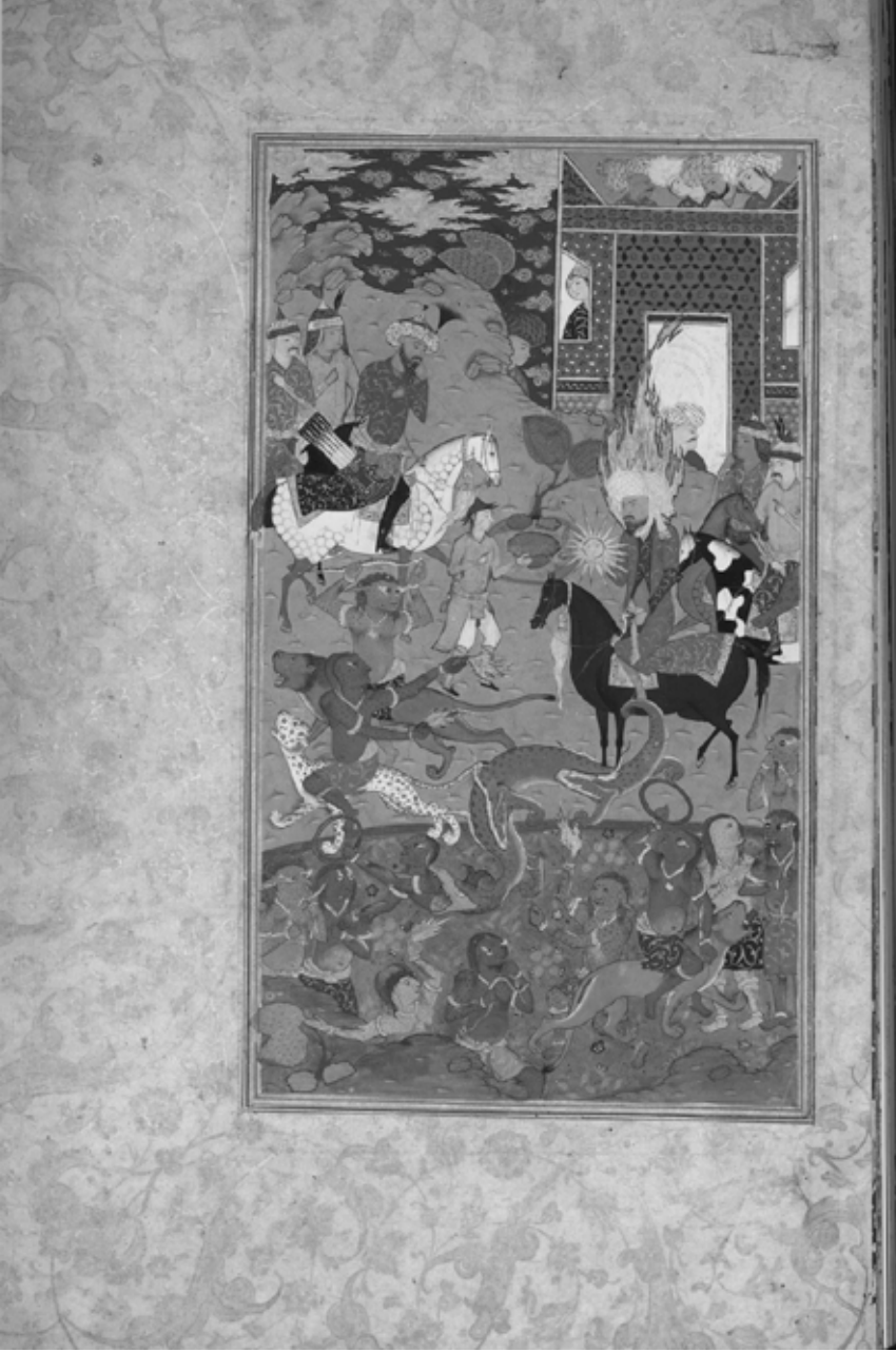
Hz. Musa'nın mucizesi, Habîbü's-Siyer , İran: Golistan Sarayı, 16.yüzyıl.