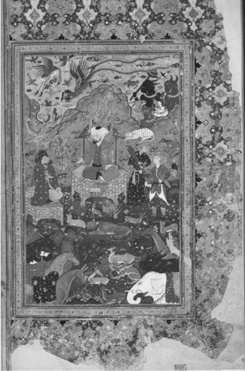
Hız. Süleyman tahtta, Ghavam Šahnâme , İıran: Reza Abbasi Müzesi, 1591.