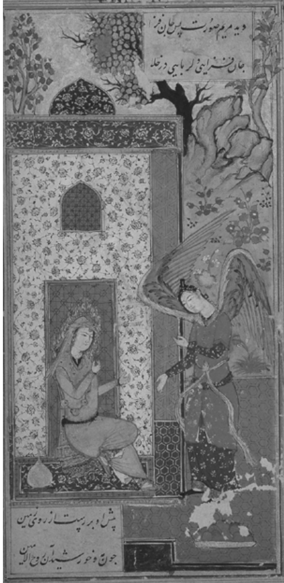
Hız. Meryem'e doğumun müjdelenmesi, Müntehabât-ı Mesnevi , İran: Golestan Saray, 1609.