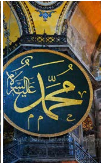
Görsel 7. Kazasker Kazasker Mustafa İzzet Efendi (1801–1876) tarafından Celî Sülûs hattı ile Ayasofya Camisi için yazılmış olan levhalar.