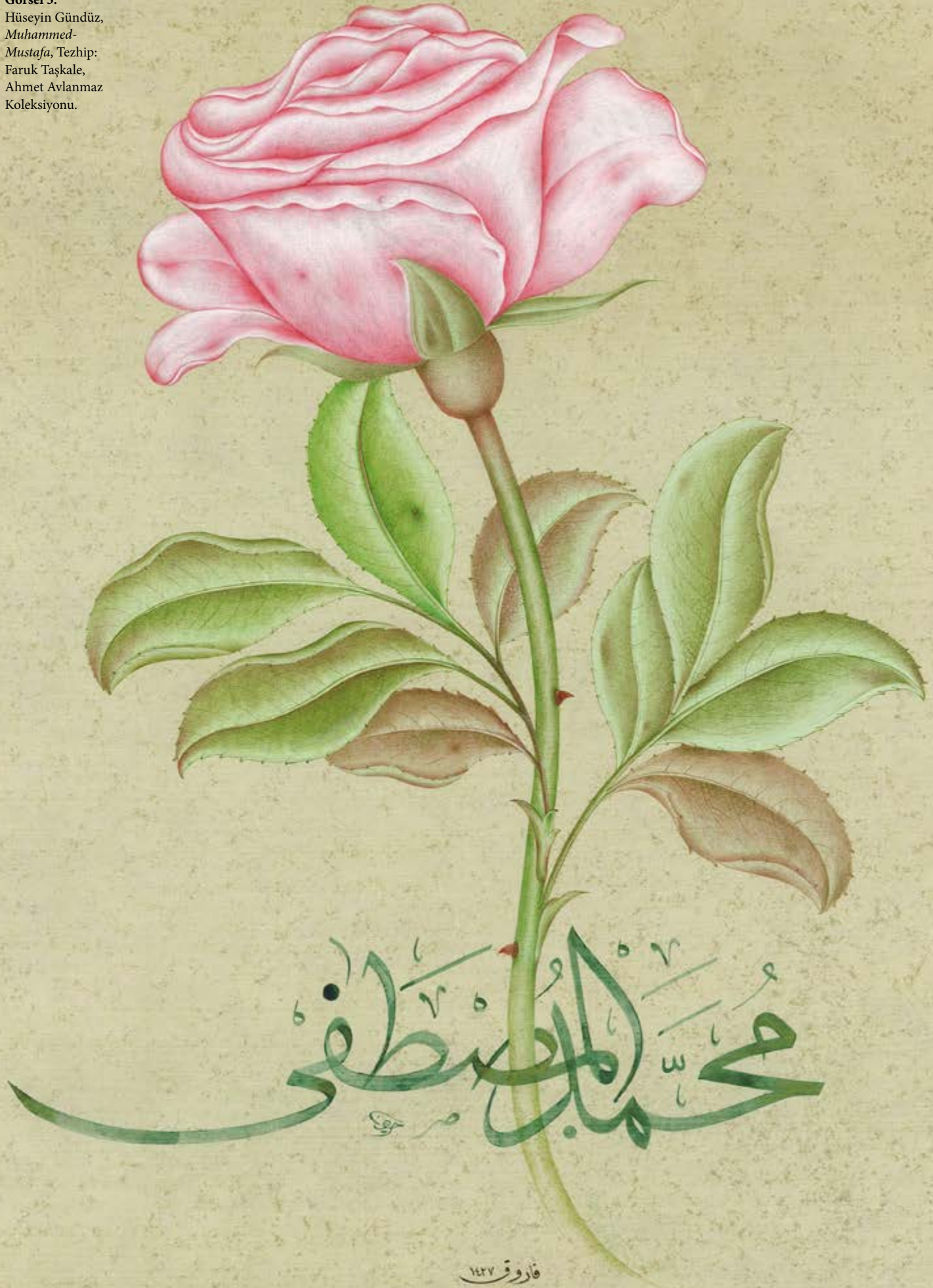
Görsel 3. Hüseyin Gündüz, Muhammed- Mustafa, Tezhip: Faruk Taşkale, Ahmet Avlanmaz Koleksiyonu.