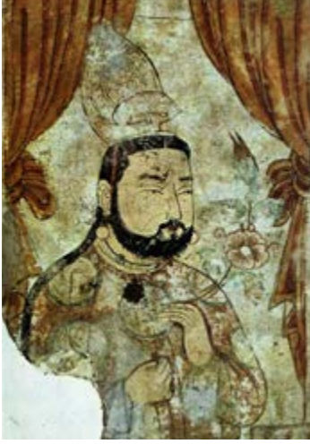
Görsel 1 Uygur Prensi 8-9. yy.