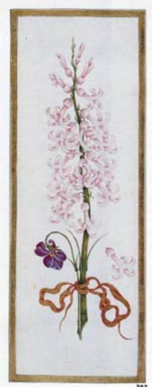
Görsel 7 -8-9 Ali Üsküdarî (İÜK 5650)

lı sanatı, 17. yüzyıla kadar dış tesirlerden uzak kalmasına rağmen 17. ve 18. yüzyılların siyasi olayları devletin dış açılmaya başlaması ve Batı'ya yönelmeye zorlanması sebebi ile sanatta ve toplumsal hayatta değişimler kendini göstermeye başlamıştır. Yüzyılın ikinci yarısından sonra Osmanlı sanatlarının bazı dallarında hissedilmeye başlanan Batı etkisi, tezhip sanatında da görülür. Bu dönemde klasik motifler ile çiçek buketleri de kompozisyonlar da yer almaya başlamıştır. 7