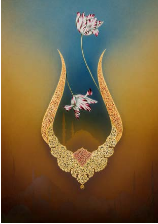
Görsel 12-13 Tezhib Sanatına Çağdaş Yaklaşımlar, Arayışlar Münevver Üçer