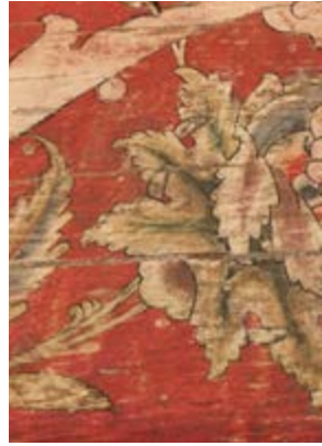
Görsel 2 - 3 Geleniğin kullanım yüzeyleri

dır. Selçuklular zamanında yapılanmaya başlanan ve kendi tarzını oluşturan tezhib; hat, çini gibi sanatlarda Sahib Ata Fahreddin Ali'nin himayesindeki sanatçılar nakkaşhâne geleniğinde çalışarak eserler üretmişlerdir. Bu, nakkaşhane geleniğinin temellerini oluşturan bir olgudur. Osmanlı İmparatorluğu İstanbul'un fethinden sonra sanat ve kültür alanında büyük bir gelişme göstermiş, Avrupa Rönesans'ını yaşarken Osmanlı coğrafyasında da klasik sanatın temelleri atılmaya başlanmıştır. El yazması eserlerin itina ile hazırlanması, bu nadide eserlerin devrin önemli kişilerine sunulmak üzere yapılması, hüsn-i hat sanatıyla birlikte tezhib sanatının da gelişmesini sağlamıştır. Bu durum, dönemin özelliklerini yansıtacak şekilde çeşitli üslupların ortaya çıkmasına da yol açmıştır (Görsel 2-3).