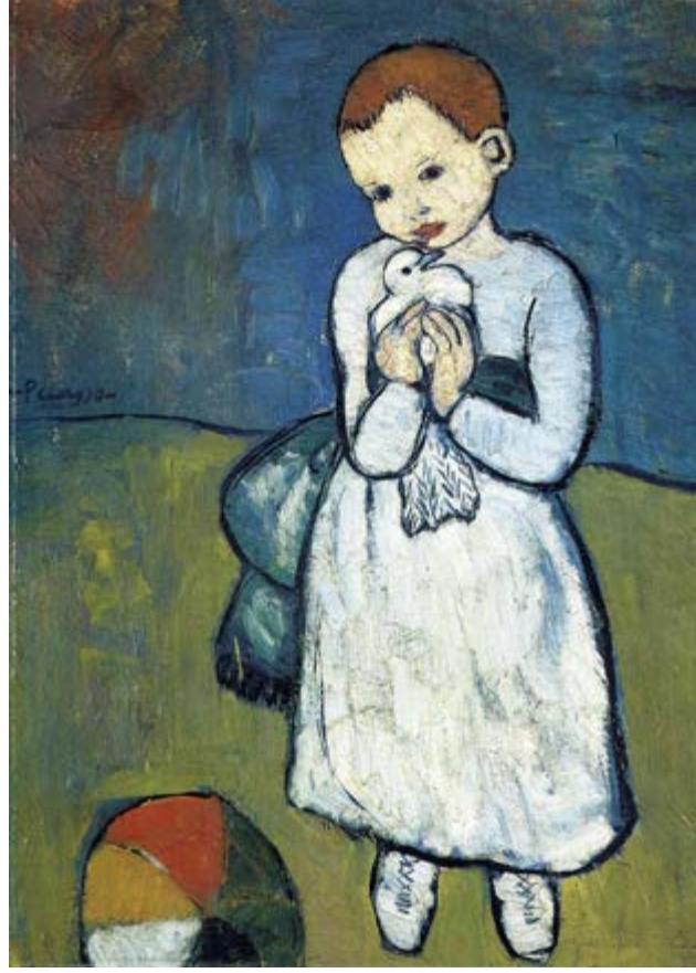
Görsel 10-11 Picasso desenleri klasik ve yorum getirdiği dönemler

dönem eserlerine bakıldığında, görülen yorum farklılıkları bu durumu gözler önüne sermektedir (Görsel 10-11).