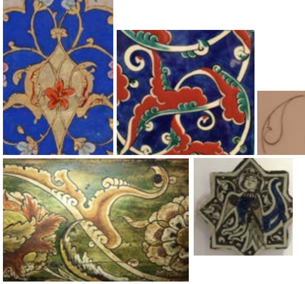
Görsel 2 - 3 Geleneğin kullanım yüzeyleri

“Her sanat yapıtının bir yaratıcısı vardır; ama yetkin bir sanat yapıtıysa eğer, özünde anonim bir şey vardır.” 3