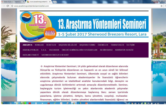
Görsel-4: 13. Seminer internet sayfası ara yüzü

rının "Temel" ve "İleri" gibi ikiye ayrılmasını ve iki dönem halinde verilmesi şeklindeki istekleri doğrultusunda iki dönem uygulamasına gidilir. Bu uygulamada, örneğin Temel SPSS, Temel Lisrel veya diğer konular, "Temel" ve "İleri" olmak üzere iki dönem halinde verilir. Amacına tam olarak ulaşmadığına kanaat getirilerek bu uygulamadan iki yıllık deneme sonrasında vazgeçilir.