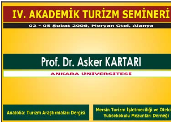
Görsel-8: Dördüncü Seminer yaka kartı

Eğitmen ağırlama giderleri: Bu başlık altında seminerlerde ders veren eğitmenlerin konaklama, ulaşım, yeme-içme, transfer ve diğer giderler yer alıyor. Bu giderler tabiatıyla düzenlenen seminer sayısına bağlı olarak değişiklik gösterse de, her