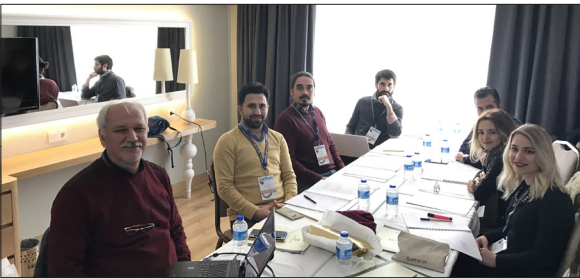
Görsel-15: Seminerlerde ders başında!

Araştırma Yöntemleri Seminerinin belki de en önemli etkilerinden biri, turizmin bir disiplin