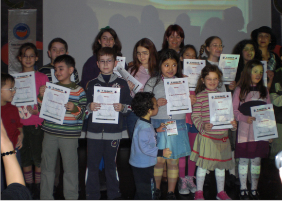
Görsel-14: Resim kursuna katılan çocuklar katılım belgeleri ile

menler de, seminerler sonrasında alanları ile ilgili pek çok kitap hazırlarlar.