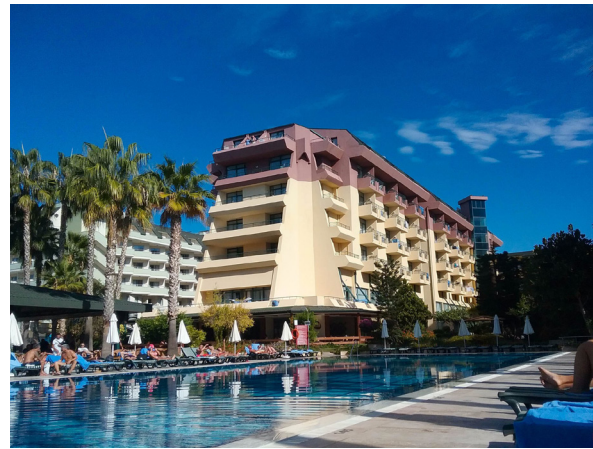
Görsel-3: Meryan otel

Bu arada 2010 ve 2011 tarihlerinde, yani 9 ve 10. seminerlerde, katılımcıların bazı seminer konula-