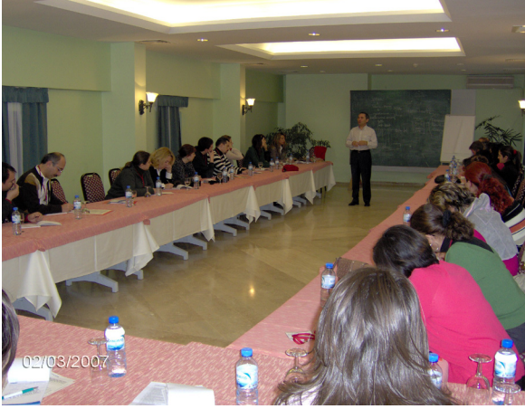
Görsel-2: Bir seminer anı

olarak her yıl seminerler düzenlenir. Düzenleme dönemleri olarak ise, 2003 ve 2004 yıllarında Mart ayındakiler dışında bütün seminerlerin düzenlenme tarihleri orta dereceli eğitim kurumlarının sömestr tatillerine denk getirilir. Bunun nedeni ise, katılımcıların önemli bir bölümünün çocuklarının ilk ve orta dereceli eğitim kurumlarında öğrenci olmalarıdır.