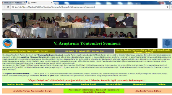
Görsel-1: Beşinci Seminer internet sayfasının ön yüzü

şüne yol açar. Bu yıllarda hazırlanan araştırma ve lisansüstü çalışmaların genelinde kuram, yöntem ve analiz bilgisinin epeyce yetersiz olduğu, o yıllarda üretilmiş çalışmalar incelenerek rahatlıkla anlaşılabilir.