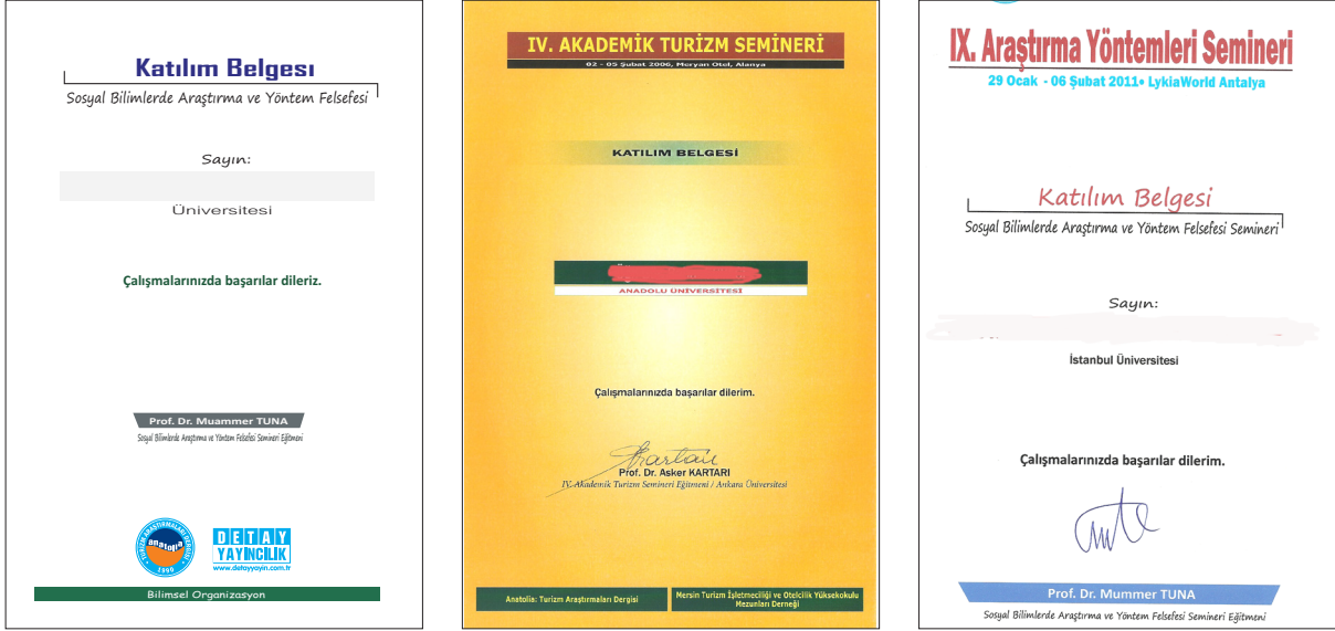
Görsel-13: Katılım belgesi örnekleri

kısa süreli de olsa, bu alanda epey seminer etkinliği ortaya çıkar, ancak seminer ücretlerinin yüksekliği dolayısıyla pek çoğu bir-iki kez düzenlendikten sonra sona erer. Mesleki ve mezun dernekleri ile birtakım disiplinlerde çalışan akademisyenlerin kurdukları sivil toplum kuruluşlarının düzenledikleri seminerler bu kapsamda değerlendirilebilir. Böyle bir eksikliğin varlığında farkındalık yaratılması bağlamında Araştırma Yöntemleri Semineri'nin önemli bir etkisi bu şekilde gerçekleşir.