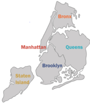
Tablo: 2 New York İlçeler ve Nüfusları

New York ABD'nin en önemli ve nüfus açısından en büyük şehri konumundadır ve aynı zamanda eyaletinde ismini taşımaktadır. New York Eyaleti'nde 62 şehir vardır ve eyalet başkenti Albany'dir. 1613 yılında Hollandalılar tarafından New Amsterdam adı ile kurulan kent 1664 yılında İngilizlerin eline geçmesiyle New York adını almıştır. 1778 yılında kent 2 yıl süreyle Amerika Birleşik Devletleri'nin başkentliğini yapmıştır. Eyalet nüfusunun %40'ı New York şehrinde yaşamaktadır. New York şehri ise idari açıdan 5 ilçeden oluşmaktadır. Bunlar, Bronx, Manhattan, Queens, Brooklyn ve Staten Adasıdır (Deik, 2012: 12-21; Dilliard, 1963).