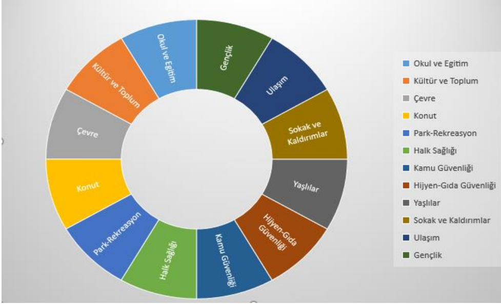
Grafik: 1 New York Sakinlerinin Teklif Sunabileceği Ana Temalar

Grafik 1’de görüleceği üzere New York sakinleri 2018 yılında 12 ana tema altında projeler sunmuşlardır. Projelerde sermaye harcamaları öncelikli olarak teklif sunulabilmektedir. Tekerlekli sandalye erişimine uygun rampalar yapılması, yol yenileme, kavşaklarda yaya güvenliğinin artırılması, yayalar ve bisikletliler için sokak bazında yol kaldırım iyileştirilmeleri, sokakların aydınlatılması, toplu konutlarda iklimlendirmesi, oyun alanları yapılması, basketbol sahası yapılması, park bankları kurulması, yenilenmesi, paten parkı, semtlerde yerel topluluk merkezlerinin yenilenmesi, bir kütüphane için yeni bilgisayarların alınması, devlet okulu için teknolojik iyileştirilmesi, okul binasının tamir ve onarımı, kamuya açık alanlarda spor egzersiz aletleri, yerel hastane ve klinik için bakım onarım yapılması, okullarda ve toplu konutlarda güvenlik kameraları kurulması, banyoların yaşlılara uygun hale getirilmesi, gençler için teknoloji merkezleri kurmak gibi talepler uygun proje kapsamına girerken özel sektöre ve mülkiyete ait bir alanın kaldırımlarının onarımı, halka açık bir binanın elektrik faturasının ödenmesi, kütüphane personelinin çalışma süresini uzatmak, hastane ve klinik için hemşire alımı, daha fazla polis memuru alınması, evde sağlık çalışanı istihdam etmek, toplu konutlarda güvenlik görevlilerinin işe alınması gibi öneriler ise uygun olmayan önerilerdir. New York katılımcı bütçe süreci Tablo 4’de gösterilmiştir.