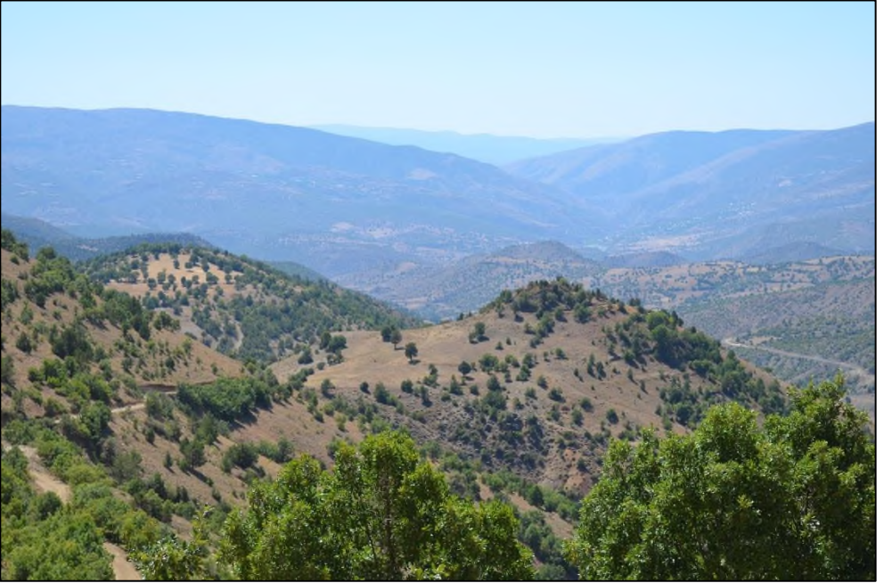
Resim 2. Karadikmen Kalesi Geç Demir Çağ Kalesi