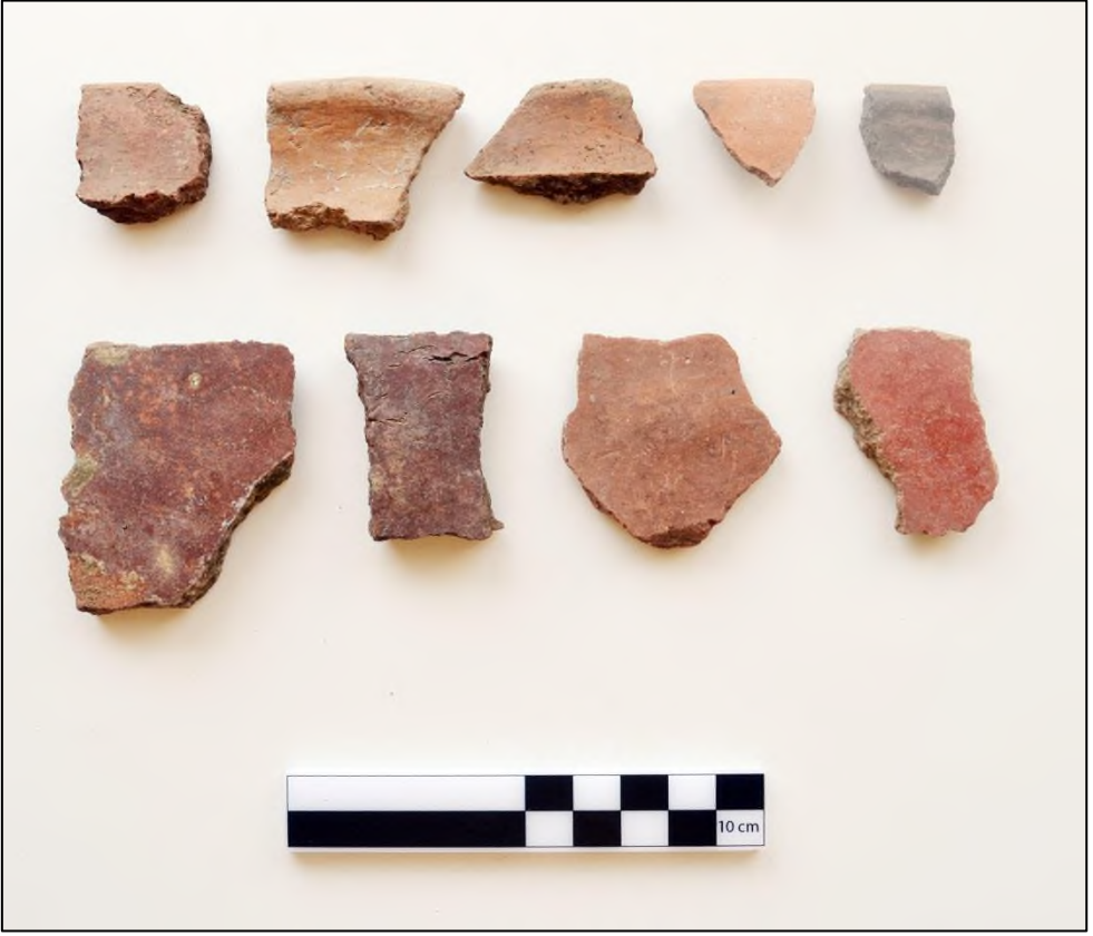
Resim 4. Karadikmen Kalesi Ge Demir aę Keramik rnekleri