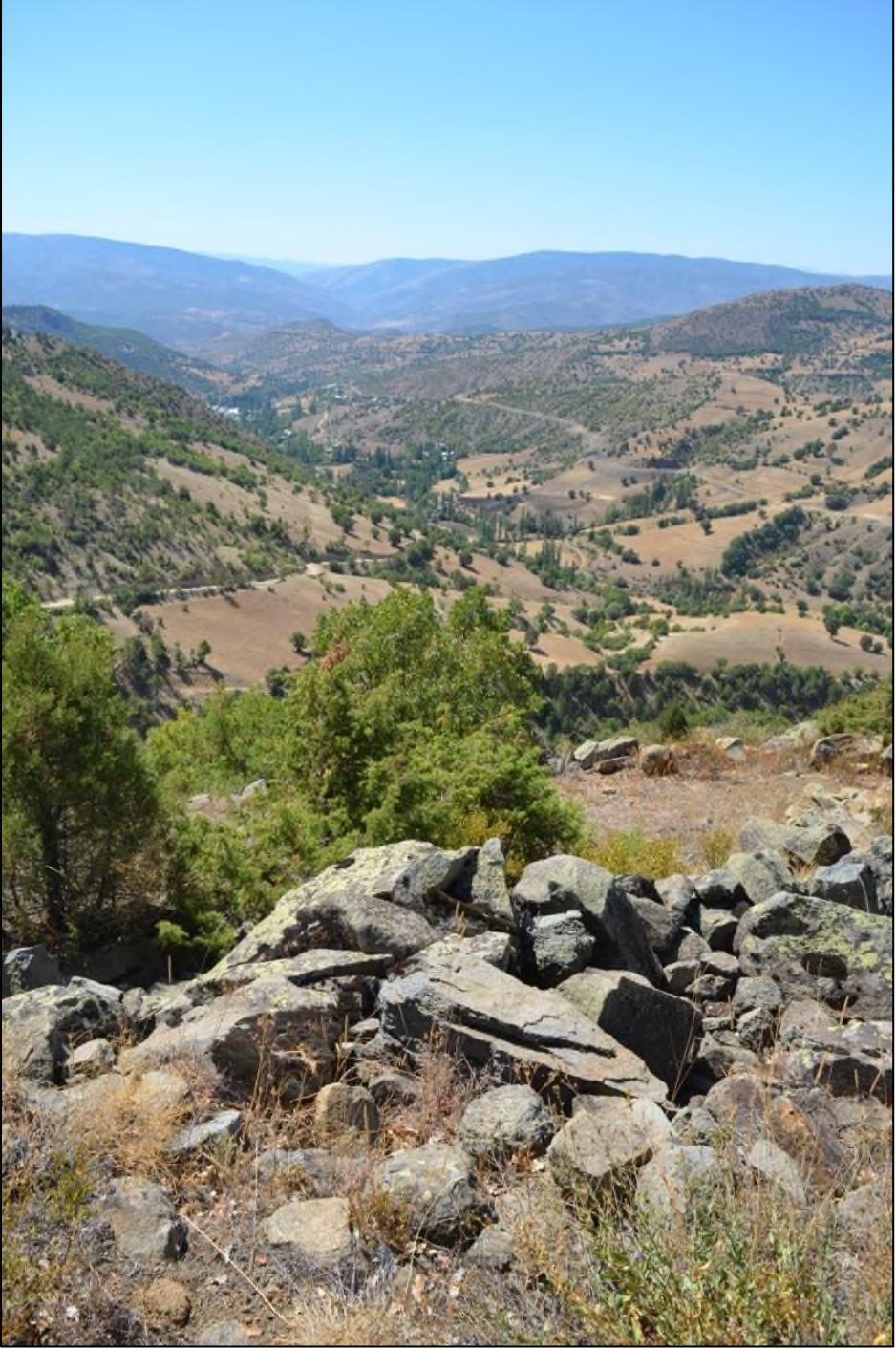
Resim 3. Karadikmen Kalesi-Mimari