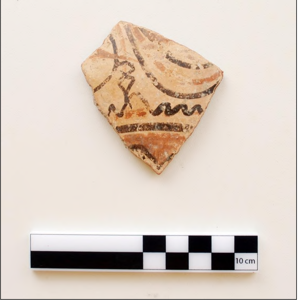
Resim 6. Karadikmen Kalesi Geç Demir Çağ Bitkisel Motifli Keramik Örneği