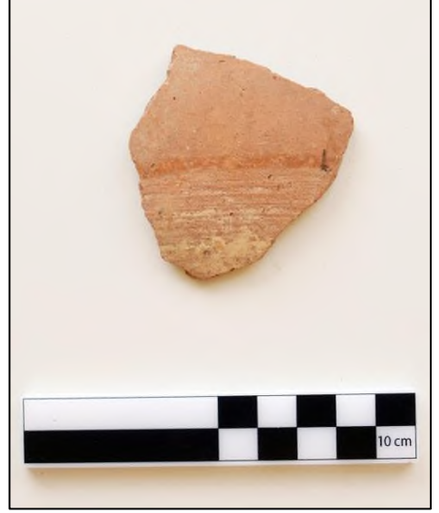
Resim 8. Karadikmen Kalesi Geç Demir Çađ Bant Bezemeli Keramik