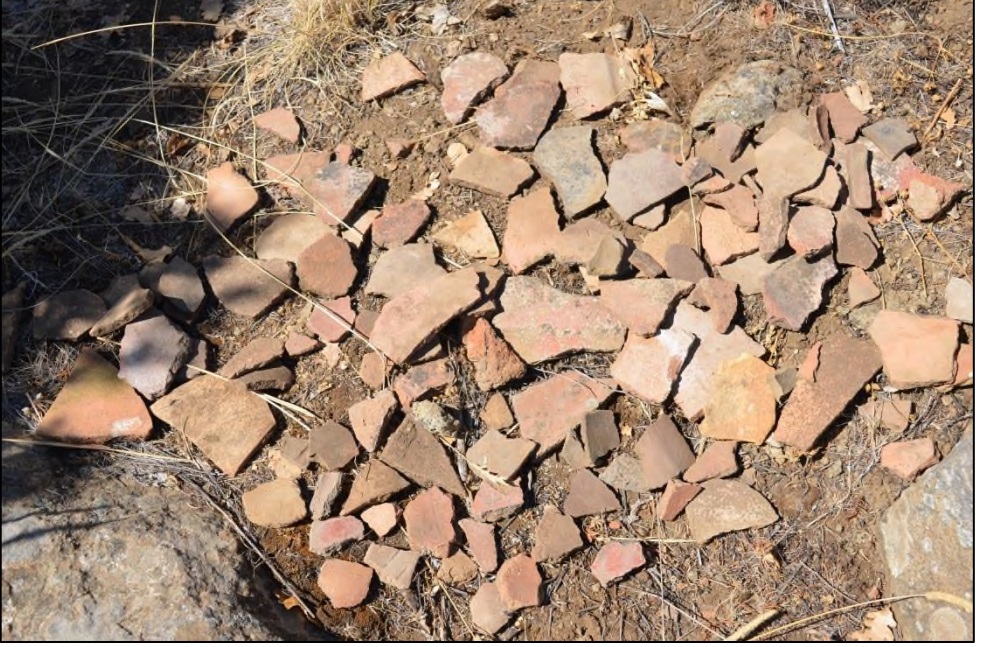
Resim 5. Karadikmen Kalesi Demir Çaęı Keramik Örnekleri