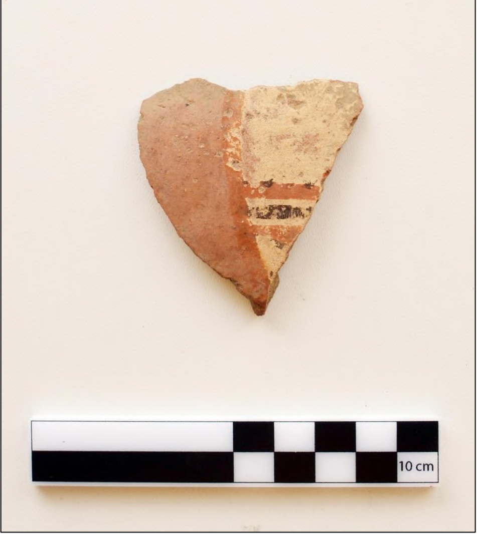
Resim 9. Karadikmen Kalesi Geç Demir Çağ Bant Bezemeli Keramik