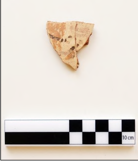
Resim 7. Karadikmen Kalesi Geç Demir Çađ Bitkisel Motifli Keramik