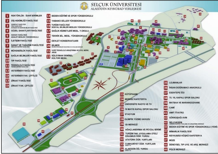
Şekil 1. Alaeddin Keykubad Kampüsü birimleri (URL-3)

Araştırma Tasarımı, Veri Toplama Aracı ve Araştırmanın Örneklemi: Suç korkusu, insanların tehlike, tehdit, risk, kaygı ve endişe gibi uyarıcılar karşısında ortaya çıkan algı, his ve duyu durumlarını ifade etmektedir. İnsanların güvensiz hissettikleri ve korku duydukları mekanları, durumları, olayları ve kişileri tespit etmek için en etkili yöntem suç korkusu belirleme veya ölçme anketi uygulamaktır (Bedimo-Rung vd, 2005, s.165; Çoklar ve Solak, 2017, s.316). Bu çalışmada ise niceliksel (anket) ve niteliksel (katılımcı gözlem ve algısal değerlendirme) sorgulama yöntemine göre öğrencilerin Alaeddin Keykubad Kampüsü'nün fiziksel çevresine ilişkin suç korkusu belirlenmeye çalışılmıştır.