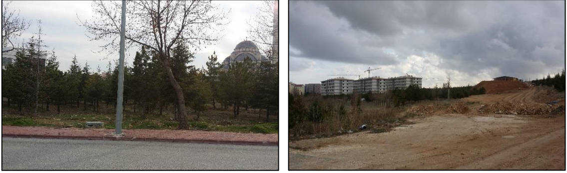
Şekil 2. Kampüste devam eden inşaatlar, bakımsız ve köhne yerler (Orijinal, 2018)