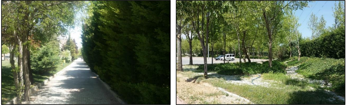
Şekil 3. Bitki örtüsünün yoğun olduğu yerler (Orijinal, 2018)