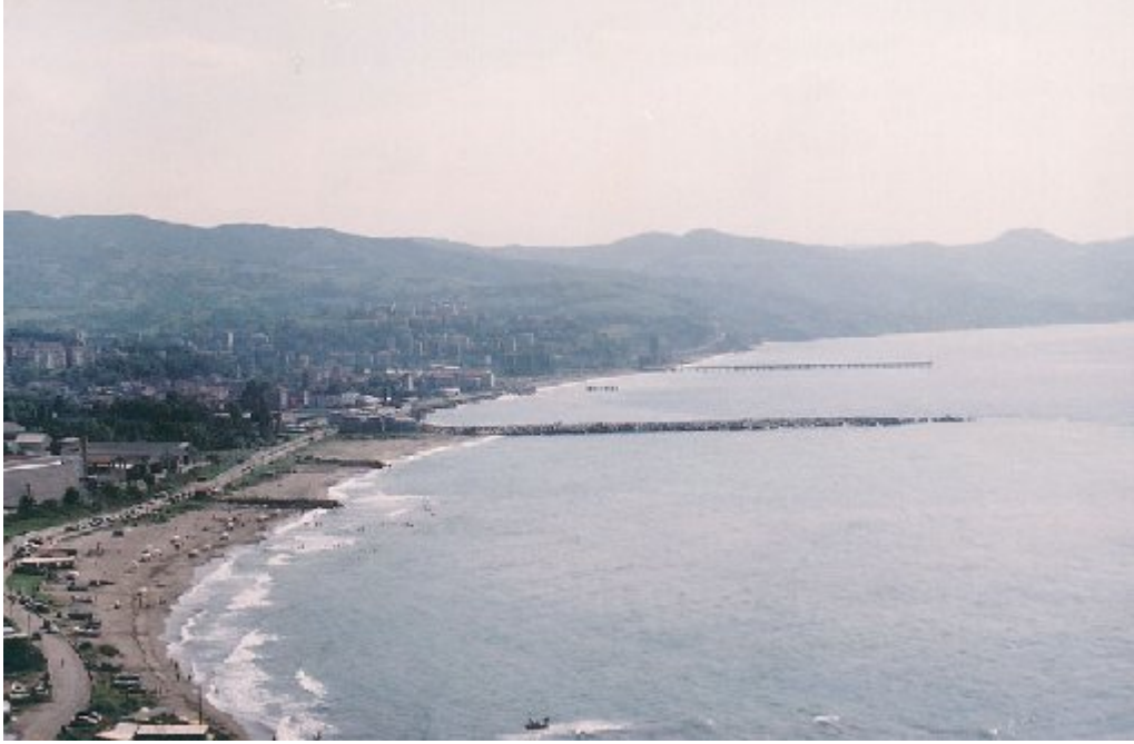
Resim-1: Alçak-basık kıyı örneği, Zonguldak.