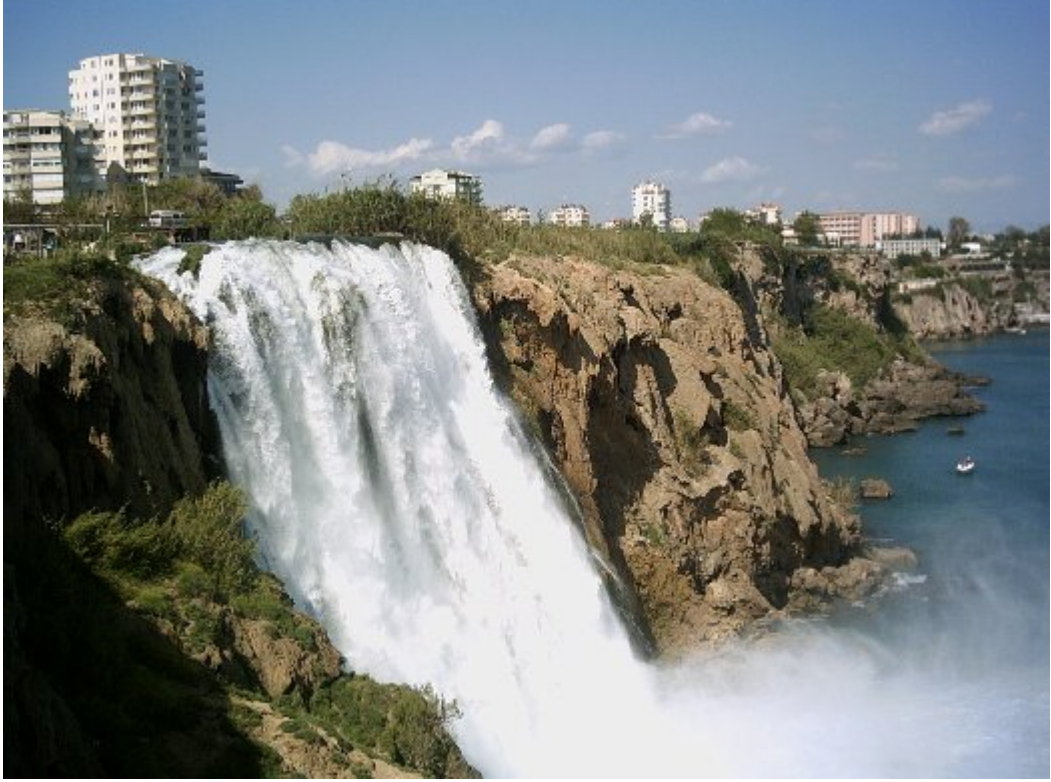
Resim-2: Dar-Yüksek kıyı örneği, Antalya.

biçiminde tanımlanan dar kıyı kavramı, bu tip kıyılarda görülen kıyı kenar çizgisini ifade etmek üzere kullanılmıştır[8].