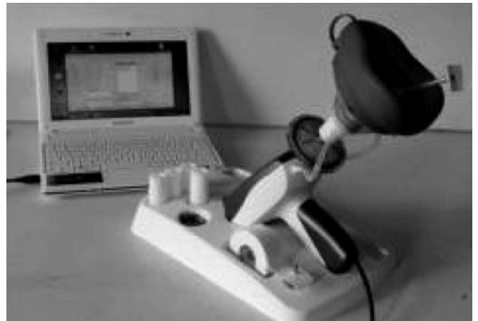
Şekil 3. In check nazal inspiratuvar akım ölçer.

2. Nazal akım: Pik nazal inspiratuvar akım (PNIF) ve pik nazal ekspiratuvar akım (PNEF) ile nazal akım değerlendirilebilir. PNIF, anterior rinomanometri ile, PNEF ise posterior rinomanometri ile korelasyon gösteren, efor ve normal ventilator kapasite gerektiren ölçümlerdir. Bu nedenle akciğer hastalığı olmayanlarda yapılmalıdır. [24] PNIF, rinit muayene bulguları ile korele olup özellikle nazal tıkanıklığın değerlendirilmesinde etkilidir. Tekrarlanabilir olması yanında ucuz, basit ve hızlı bir metodur. [25] Nazal inspiratuvar akım ölçer için hem ağız hem burnu içine alan maske yardımı ile hasta dudaklarını sıkıca kapatıp burundan kuvvetli inspirasyon yaptırılır (Şekil 3). Hatalı sonuçlara karşı hastanın ağızından kaçak olmaması, nazal sekresyonların bulunmaması, burunda tam tıkanıklık olmamasına dikkate edilmelidir. [7] Akciğer kapasitesinde düşüklük, sigara içimi sonuçları olumsuz yönde etkileyebilir. 20-350 ünite (L/dk) arası skalada birbirini izleyen üç ölçümden en yüksek olanı dikkate alınmalıdır. PNIF için normal değerlerin bulunmaması nedeniyle sağlıklılar referans alınmalıdır. [24] Rinomanometri, normal nefes alma esnasında burunda oluşan basınç ve akım ilişkisini ölçer. Ak-