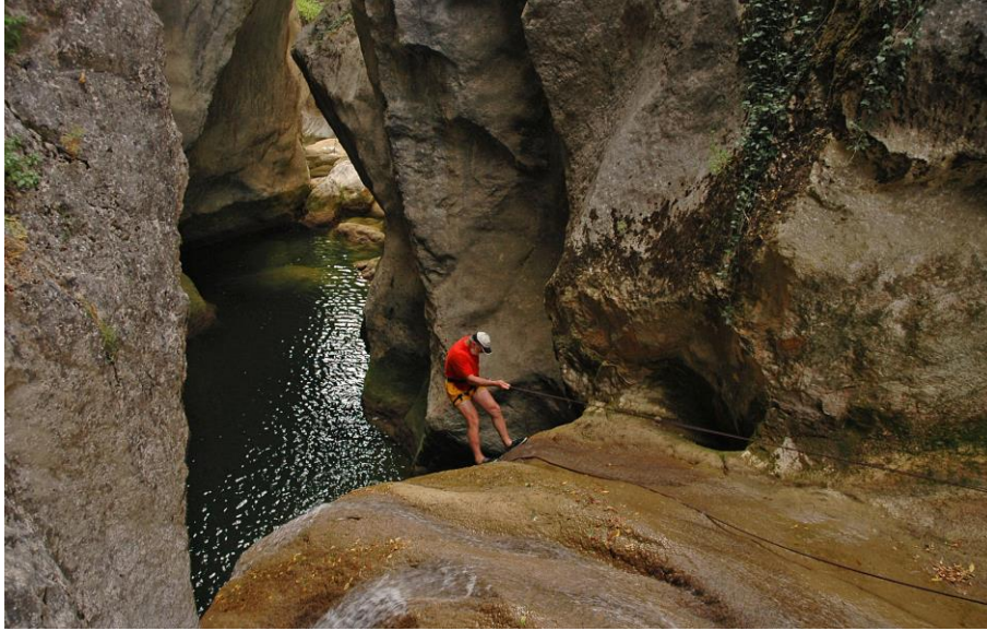
Resim 3: Yacı kanyonu (Türker ve Çetinkaya, 2009).

Yörük sahip olduğu doğal kaynaklar nedeniyle doğa turistlerinin ilgisini çekebilecek bir potansiyele sahiptir. Köyün sınırlarından geçen Yacı Kanyonu bu kaynakların en önemlileri arasındadır (Resim 3). Sakaralan Köyü'nün Yacı Mahallesi yakınından başlayarak Yörük Köyü sınırlarından geçen Yacı Kanyonu 6 saatte geçilebilmektedir. Kanyonda halihazırda kanyon yürüyüşü yapılmakta, kanyon özellikle yerli ziyaretçilerin ilgisini çekmektedir. Safranbolu ilçesi sınırlarında bulunan üç kanyon; Sırçalı, Düzce ve Yacı kanyonları Konarı köyü civarında birleşmektedir.