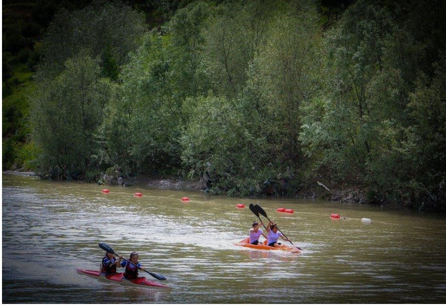
Resim 4: Araç çayı (Anonim 2014)

Köy ayrıca kırsal yaşamın izlenebildiği, geleneksel yaşamın hala önemini koruduğu, Bektaşî yaşamının izlerinin sürülebildiği bir yer olarak ekoturistlerin ilgisini çekebilecek yöresel kültüre sahiptir. Yörük köyünde her yıl düzenli olarak etkinlikler yapılmaktadır. Etkinlikler her yıl ya Ağustos ayının son haftası ya da Eylül ayının ilk haftası yapılmaktadır. Yörük köyü etkinliklerinde geçmişte seymenler eşliğinde gösteriler yapılırken günümüzde kıl çadır kurulup yemek verilmektedir. Etkinlikler, her yıl köyün yerlilerinden birisinin köy ağası seçilmesi ve masrafları karşılaması ile düzenlenmektedir. Köy ağası etkinliğin bütün giderlerini karşılamaktadır (Resim 5).