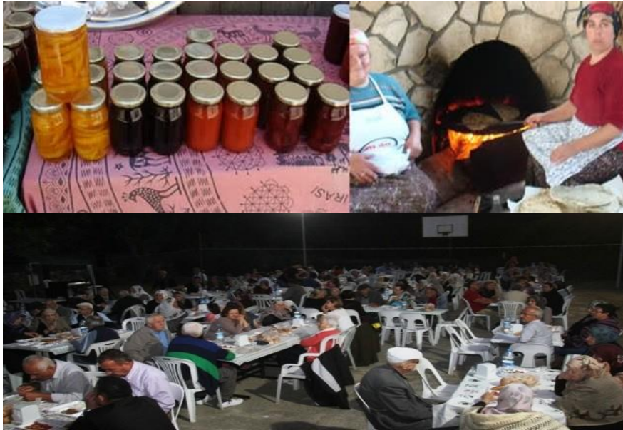
Resim 5: Yörük Köyü Etkinlikleri

Köy ayrıca kırsal yaşamın izlenebildiği, geleneksel yaşamın hala önemini koruduğu, Bektaşî yaşamının izlerinin sürülebildiği bir yer olarak ekoturistlerin ilgisini çekebilecek yöresel kültüre sahiptir. Yörük köyünde her yıl düzenli olarak etkinlikler yapılmaktadır. Etkinlikler her yıl ya Ağustos ayının son haftası ya da Eylül ayının ilk haftası yapılmaktadır. Yörük köyü etkinliklerinde geçmişte seymenler eşliğinde gösteriler yapılırken günümüzde kıl çadır kurulup yemek verilmektedir. Etkinlikler, her yıl köyün yerlilerinden birisinin köy ağası seçilmesi ve masrafları karşılaması ile düzenlenmektedir. Köy ağası etkinliğin bütün giderlerini karşılamaktadır (Resim 5).