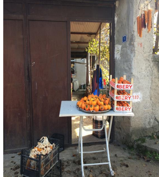
Resim 1,2: Yörük köyünde seyyar satış yapılan yöresel ürün tezgâhları

Köy anıtsal değerleri, tarihi boyutu ve evlerinin özelliklerinin yanında doğal zenginlikleri ile de ender alanlardandır. Bu nedenle yıl boyunca yerli ve yabancı turistler bu yöreyi ziyaret etmektedir. Kültürel turizmin gelişimi köy halkını olumlu ve olumsuz yönde etkilemiştir. Türker v.d. (2011)'in yaptığı araştırmaya göre Yörük köyü halkı turizmin yeni iş imkânları yaratarak istihdamı attıracağına inanmaktadır. Ancak cevaplayıcıların üzerinde önemle durduğu konu turistik gelişmenin köyün ekonomik yaşamı üzerinde beklenen düzeyde gelişme sağlamadığı yönündedir. Köyün genç nüfusunun daha iyi iş imkânları sebebiyle büyük şehirlere ve özellikle İstanbul'a göç ettikleri, böylece de geleneksel yaşam biçiminin tahribata uğradığı ve kısmen de olsa koyun boşaldığı yönünde tespitlerde bulunmaktadır. Turizmden beklenen gelecekte köyde daha çok iş imkânları yaratarak genç nüfusun köyde kalmasını sağlanmasıdır. Yerli halk turizmin doğal çevre üzerinde olumsuz etki yapmadığına, turistlerin çevre