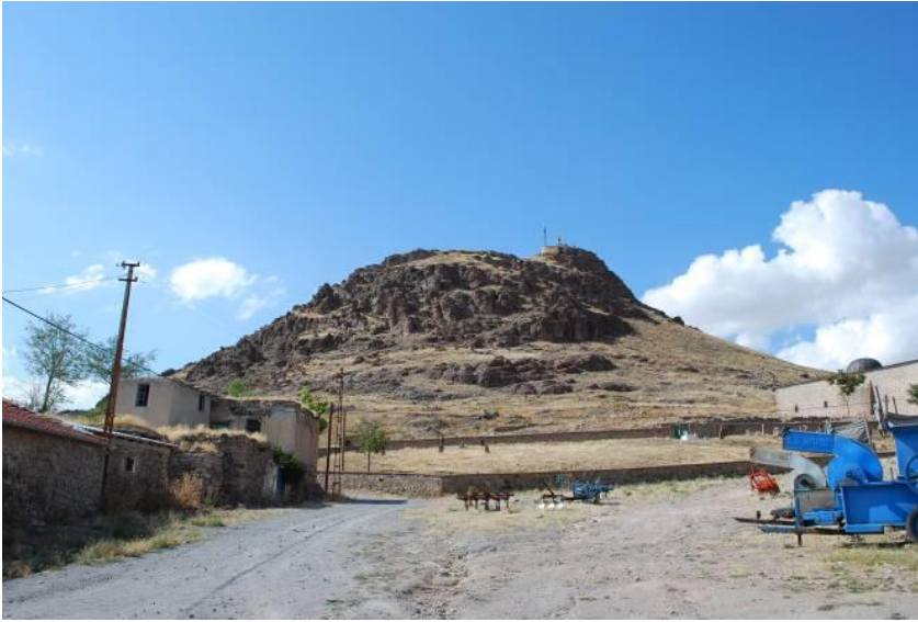
Foto. 2. Ulu Caminin Bulunduğu Alandan Develi Kalesi'nin Görünüşü