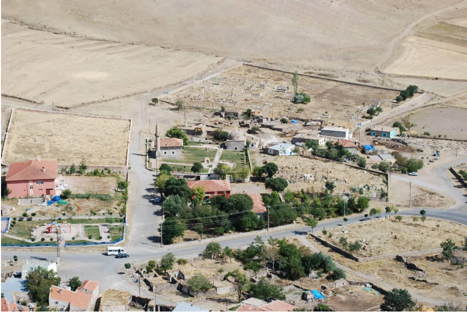
Foto. 5. Seyyid Şerif Türbesi ve Yerleşme Alanı