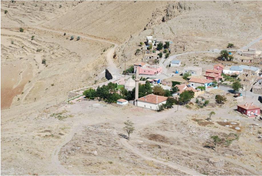
Foto.4. Dev Ali Türbesi ve Yerleşme Alanı