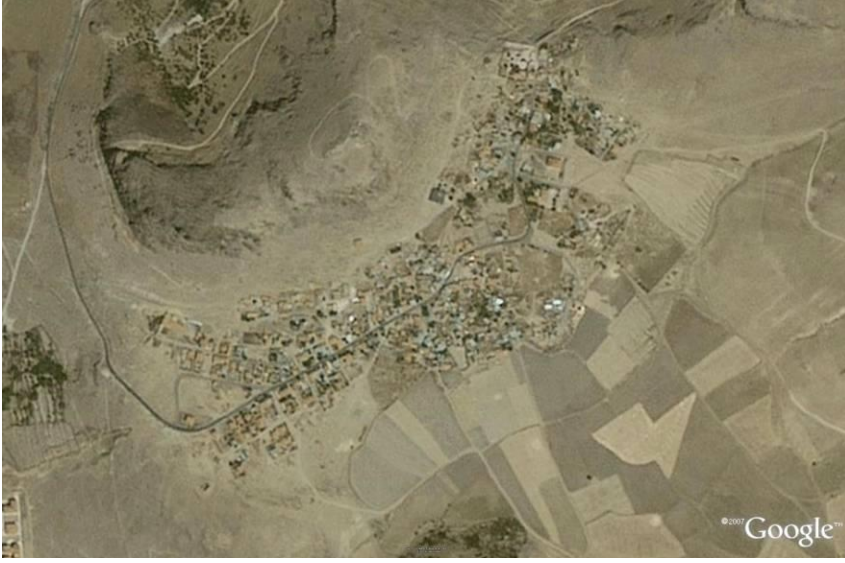
Foto. 1. Develi Şehri ( http://www.google.map , Turkey, Develi) erişim tarihi 25.08.2012