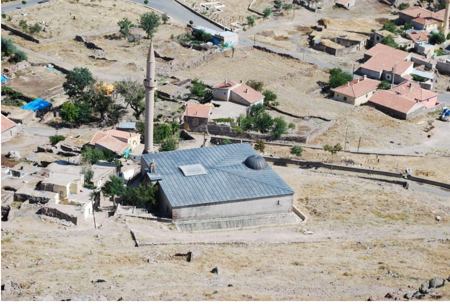
Foto. 3. Develi Ulu Camisi ve Yerleşme Alanı