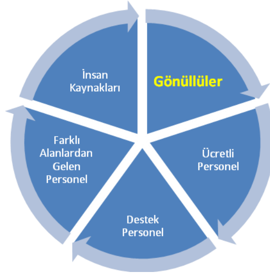
Şekil 2. Spor organizasyonlarında komite yapısı

Spor organizasyonlarındaki komiteler ve gönüllülerin döngüsünü Şekil 2’de ifade etmek mümkündür (Bu döngü Erzurum 2011 Üniversitelerarası Kış Oyunlarından esinlenerek oluşturulmuştur). Organizasyon Komitelerinde iyi hazırlanmış bir gönüllü grubu bir aktivitede başarıya ulaşmayı kolaylaştırabilir. UEFA Education Programme (2011), futbol organizasyonlarında gönüllü seçimi aşamalarını aşağıdaki gibi sıralamaktadır [22]: