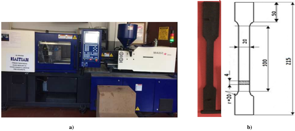
Şekil 2. a) Plastik Enjeksiyon Makinesi b) Standart Test Çubuğu

Enjeksiyon kalıplama yöntemi, plastik malzemelere uygulanan üretim yöntemlerinin başında gelmektedir. Yapılan literatür çalışmalarında [5-6] grafit oranı %1 olarak kullanılmıştır. Bu çalışmada ham polipropilen (PP) ve % 1 oranında grafit partikülleri takviyeli polipropilen (GPP), çift vida etkili ekstrüderde homojen karışımı yapılarak enjeksiyon makinesinde 100 adet standart test çubuğu üretilmiştir. Şekil 2' de a) Enjeksiyon makinesi b) üretimi yapılan standart test çubuğu gösterilmiştir. Şekil 2'de enjeksiyon makinesinde, 45 mm/sn enjeksiyon hızı ve 50 bar üretim basıncı ile tek vidalı kovan içerisinde dikdörtgen kesitli numuneler halinde üretilmiştir. Plastik çekme test çubuklarının ölçüleri (ASTM D638) standardında yapılmış ve plastik çekme test çubuğu imalatı enjeksiyon kalıplama yöntemi ile üretimi yapılmıştır.