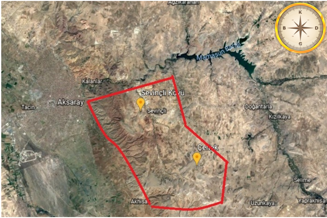
Şekil 1. Araştırma alanının sınırlarını gösteren uydu görüntüsü.