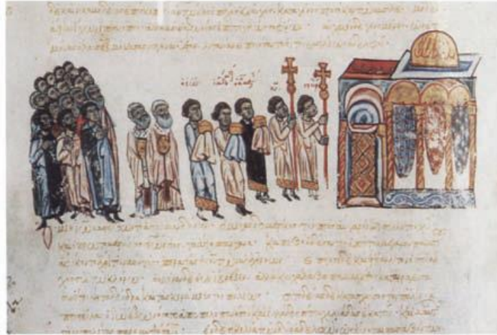
Resim 1 – Ioannes Skylitzes'e ait Madrid Kroniği, (Evans ve Wixom, 1997, s. 11 kat. 338).

Bizans döneminde minyatürlü el yazmaları, tören haçlarının nasıl kullanıldıklarına ilişkin görsel bilgiler sunmaktadır. Örneğin 11. yüzyıla tarihlenen Ioannes Skylitzes'e ait Madrid Kroniğinde, yer alan minyatürlerin birinde, Konstantinopolis'teki bir kuraklığa son vermek için düzenlenen tören tasvir edilmiştir. Minyatürde, tören alayının önündeki iki rahip ellerinde uzunca saplı tören haçlarını taşırken gösterilmiştir (Resim 1).