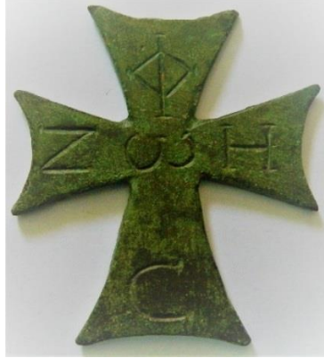
Resim 3 – Bandırma Arkeoloji Müzesi Bronz Adak Haçı

Bandırma Arkeoloji Müzesi koleksiyonunda on adet bronz 6 haç bulunmaktadır. Çalışmamız sırasında haçlar kilisede kullanılan ve boyunda asılarak taşınan pendentif haçlar olmak üzere iki grup altında incelenmiştir. Müze koleksiyonunda bir adet adak haçı bulunmaktadır (Kat. no. 1). Haçın, ahşap bir asaya geçirilebilecek şekilde silindirik veya aşağıya doğru sivrilen yassı bir levhası olmadığından takdis veya tören haçı olarak nitelmemiz mümkün değildir. Eserin boyutunun küçük olması ve üzerinde yazıt bulunmasından dolayı adak haçı olarak değerlendirilmiştir 7 . Eser, Latin haçı biçiminde, haç kolları merkezden dışarıya doğru genişlemekte ve içbükey olarak sonlanmaktadır. Haçın ön yüzünde kazıma tekniğinde yapılmış Grekçe yazıt yer almaktadır. Yazıtta harfler, haç kollarının üzerinde yukarıdan aşağıya ΦΩC (ışık) ve soldan sağa ZΩH (yaşam) olarak okunmaktadır (Resim 3). Adak haçının biçim açısından yakın benzer örnekleri Walters Art Museum'da bulunan 57.629 ve 57. 630 müze envanter nolu haçlardır 8 .