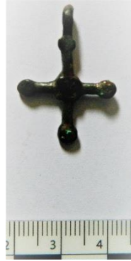
Resim 9 – Bandırma Arkeoloji Müzesi’ndeki Bronz Pandantif Haç

Bandırma Arkeoloji Müzesi koleksiyonunda yer alan diğer bir pandantif haçın kolları ince ve dairesel kesitlidir. (Kat no. 8). Kolların uç kısımları küre, merkezi ise kare şeklindedir (Resim 9). Pandantifin yakın benzeri Edesa Müzesinde envanter no. Ed/M16 eserdir. Edesa Müzesi’ndeki örnekte haç kollarının birleşme yeri kare şeklinde düzenlenmemiştir. Pandantif haç 10.-12. yüzyıllar arasına tarihlendirilir (Paisidou, 2002, s. 500, kat. 683).