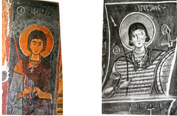
Resim 2a-2b – Niğde Andabalis Kilisesi Aziz Mamas ve Göreme Karanlık Kilise'de Aziz Orestes (Warland, 2012, ss. 369-384, res. 9- 10).

Bu tür pandantif haçların bir kayış, ip veya zincir ile boynuna asıldığı bilinmektedir. Bizans görsel sanatında özellikle Kapadokya Bölgesindeki kaya kiliselerindeki duvar resimlerinde bazı örneklerde azizler boyunlarında zincire asılmış pandantif haçlarla betimlenmiştir. Örneğin Niğde Andabalis Kilisesi'nde Aziz Mamas ve Göreme Karanlık Kilise'de Aziz Orestes boynunda zincire takılmış pandantif haçlarla gösterilmişlerdir (Warland, 2012, ss. 369-384, res. 9-10) (Resim 2 a-b).