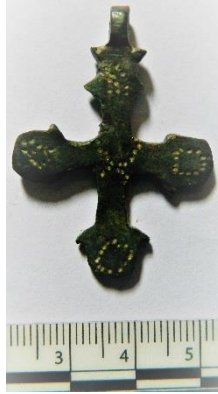
Resim 6 – Bandırma Arkeoloji Müzesi'ndeki Bronz Pandantif Haç

Bandırma Arkeoloji Müzesi'nde yer alan iki adet pandantif haçın yassı kesitli kolları merkezden dışa doğru hafif genişlemektedir. Kolların uçları iki yandan dışa taşkın birer küçük yarım daire ile sonlanmaktadır (Kat no. 6, 7) (Resim 5c.-6). Bu tür pandantif haçlar, Bizans döneminde yaygın olarak kullanılmıştır. Çeşitli kazıların Bizans dönemi tabakalarında ve müzelerde bulunan bu biçimdeki bronz pandantif haçların üzerlerinde farklı süslemeler yer almaktadır. Örneğin Zeytinli Bahçe-Birecik (Urfa) kazılarında bulunan haçın üzerinde İsa betimi (Dell'era, 2012, ss. 404-405), Sagalassos kazılarında bulunan haçın üzerinde ise geometrik desenler, görülmektedir (Cleymans ve Talloen, 2018, s. 288, res. 5h-5ı). Yine Yunanistan'da Abdera Müzesi'nde bulunan M.A. 6699 envanter nolu, aynı biçimli pandantif haçın üzerinde yazıt ve kollarında noktalardan oluşan süsleme yer almaktadır. Eser Orta Bizans Döneminde 11.-12. yüzyıl içinde değerlendirilmiştir (Zikos, 2002, s. 504 kat. 691). Katalog no. 6'nın oldukça benzeri Aksaray Müzesi'ndeki A3744/24.06.2007 nolu pandantif haçtır. Eser 9.-11. yüzyıla tarihlenmektedir (Ünlüler, 2019, s. 97, kat. no. 75).