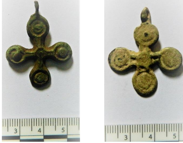
Resim 7 – a.-b. Bandırma Arkeoloji Müzesi’ndeki Bronz Pandantif Haçlar

Bu haçların benzer örnekleri Türkiye ve Türkiye dışındaki kazılarda bulunmuştur. Sagalassos kazılarında aşağı agoradaki, 2 nolu mezarda bu tarz haç kolye ele geçmiştir. Mezardaki iskelet üzerinde yapılan radiokarbon testi sonucunda iskelet 1025-1168 yılları arasına dolasıyla da haç da aynı zaman dilimi içine yerleştirilmiştir (Cleymans ve Talloen, 2018, s. 288, res. 5c, 5d). Benzer haç örnekleri, Selanik mezar kazılarında da bulunmuş ve 13. yüzyılın ortalarından, 15. yüzyılın ortalarına tarihlendirilmiştir (Antonaras, 2012, s. 123 res. 10). Ayrıca, Heraklia Perinthos (Marmara Ereğlisi)’da bir mezar buluntusunda benzer pendentif haçlar ele geçmiş ve 9.-12. yüzyıl arasına tarihlenmiştir (Westphalen, 2012, ss. 132-134 res. 5-6). Çeşitli kazı ve müzelerdeki benzer örnekleri göz önüne alındığında bu tarz haç kolyelerin de 9.-15. yüzyılın sonlarına kadar kullanıldığı anlaşılmaktadır.