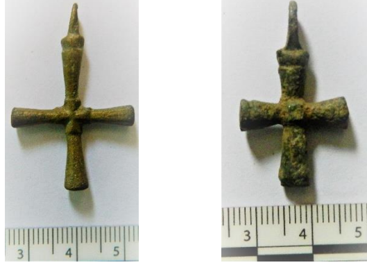
Resim 8 – a.-b. Bandırma Arkeoloji Müzesi’ndeki Bronz Pandantif Haçlar

Diğer bronz pandantif haçın (Kat. no. 10) merkezi kare şeklindedir. Sinop-Dikmen Nekropolü Kazılarında bir bebeğe ait mezarda 6.-7. yüzyıla tarihlenen aynı biçimdeki haç örneği ele geçmiştir (Köroğlu ve Vural, 2017, s. 351, fot. 7). Bu haçın diğer benzeri Selanik, Bizans Kültürü Müzesi’ndeki 12.-13. yüzyıla tarihlenen envanter BA 43/2 nolu eserdir (Marki, 2002, s. 505 kat. no. 693).