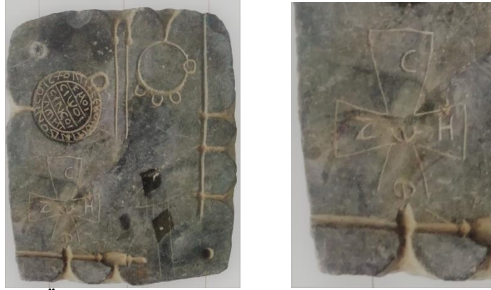
Resim 4 – a-b Ödemiş Müzesi Siyah Bazalt Kuyumcu Kalıbı (Mercangöz, 2007, s. 257).

Haçın üzerindeki yazıtın benzer örneği Selanik Bizans Kültürü Müzesi'nde bulunan BA 43/1 envanter nolu kolye haç üzerinde görülmektedir (Maremveliotaki, 2002, s. 504 kat. no. 692). Söz konusu eser 12.-13. yüzyıllara tarihlenir. Yine Ödemiş Müzesi'nde Orta Bizans Dönemine tarihlenen 1746 envanter nolu siyah bazalt taşından yapılmış dökme kuyumcu kalıp üzerinde bir pandantif haça ait negatifte Grekçe \phi\omega\epsilon (ışık), Z\omega H (yaşam) (Resim 4) yazılıdır (Mercangöz, 2007, s. 257).