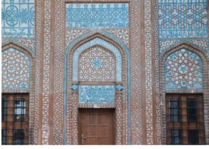
Resim 21: Sivas, İzeddin Keykavus Darüşşifahanesi.