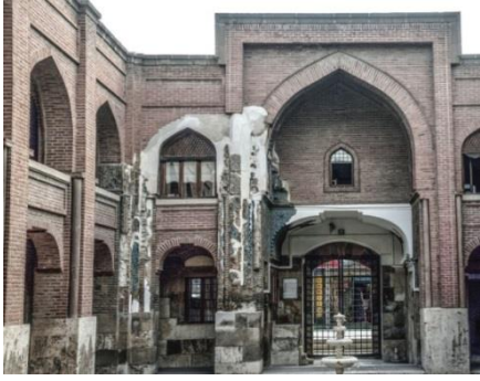
Resim 35: Konya Sırçalı Medrese. Medrese, Detay.