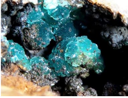
Resim 1: Turkuaz Renkli Taş Renkli Taş