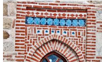
Resim 44-46: Akşehir Seyyid Mahmut Hayrani Türbesi, Detaylar.