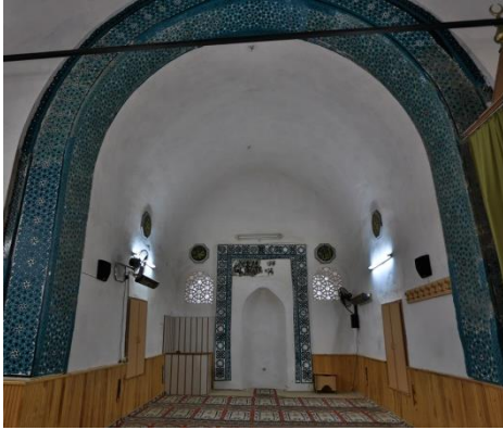
Resim 56: Konya Sahip Ata Cami.

Afyonkarahisar Çay Taş Medresesi, 3. Gıyaseddin Keyhüsrev zamanında 1278 yılında Ebu'l Mücahid Yakup oğlu Yusuf Bey tarafından mimar Oğul beye yaptırılmıştır. Medresenin içindeki çiniler yeşile dönük turkuaz (firuze), geometrik desenler ve yazı kullanılmıştır (Resim 56-57), (Karpuz, 2012; s. 38).