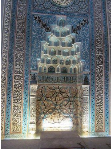
Resim 62: Ankara Aslanhane Cami, Mihrap. Detay.

Ankara Aslanhane (Ahi Şerafettin) Cami, Ahi Şerafettin tarafından 13. yüzyıl başında yaptırılmış, 1289–1290 yılları arasında tamir ettirilmiştir. Türbe duvarına gömülü bir antik aslandan dolayı Aslanhane adını almıştır. Camide Mihrap çini mozaik tekniğinde yapılmıştır ve yine turkuazın muhteşem duruşu karşımıza çıkmaktadır (Resim 62-63), (Karpuz, 2012; s. 84).