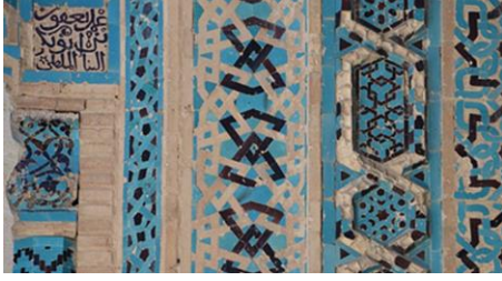
Resim 25: Malatya Ulu Cami, Detay. Cami, Detay.