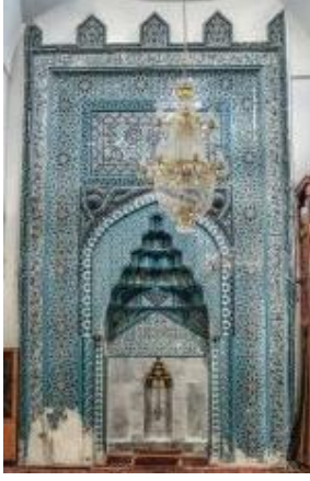
Resim 17: Kayseri Güllük Medresesi, Mihrap. Mihrap, Detay.