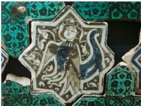
Resim 10: Kubadabad Büyük Saray, Turkuaz (Firuze),