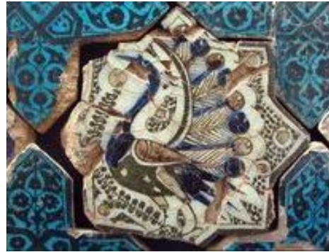
Resim 11: Kubadabad Büyük Saray,

Tavus kuşu Figürü, Karatay Medresesi Müzesi.