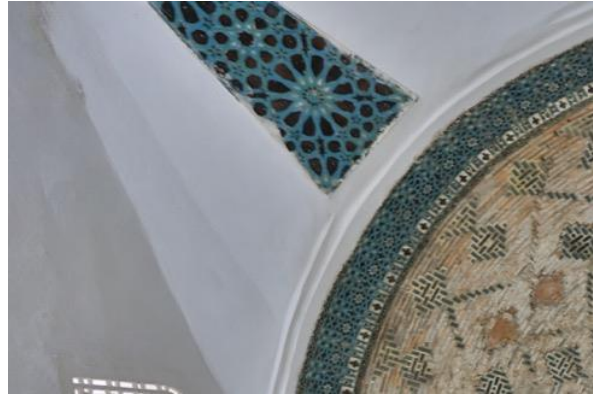
Resim 57: Konya Sahip Ata Cami, Detay.

Amasya Torumtay Türbesi, diğer adı ile Gök Medrese, Amasya Valisi Seyfeddin Torumtay bin Abdullah tarafından 1278 yılında yaptırılmıştır. Yapıda düz turkuaz çiniler ve geometrik desenli çiniler dikkat çeker (Resim 58-59), (Karpuz, 2012; s. 75).