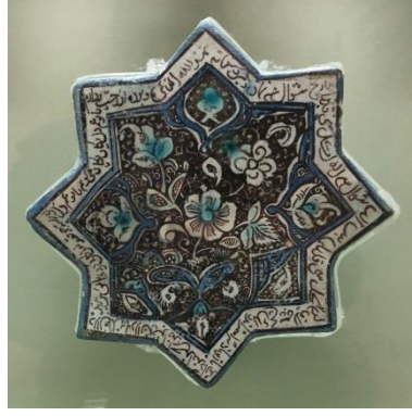
Resim 6: Çinili Köşk Müzesi, Lüster Tekniğinde Çini.

Yine aynı dönem tekniği olan Konya Alâeddin Sarayında rastladığımız Minai tekniğinde, yedi renk kullanılmıştır. Renklerin bir kısmı sır altına bir kısmı sır üstüne uygulanmıştır (Bakır, 1999; s. 10). Sır altına mor, mavi, yeşil ve turkuaz kullanılırken, şeffaf sırlama yanında nadirde olsa lacivert ve turkuaz sır kullanıldığı da görülmüştür (Resim 7).