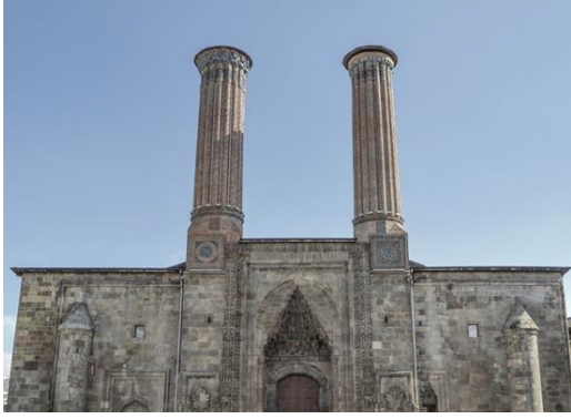
Resim 64: Erzurum Çifte Minareli Medrese. Medrese, Detay.