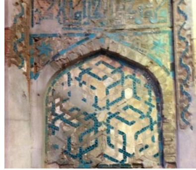
Resim 31: Tokat Ali El Tusi Kümbeti, Alınlığı.