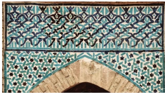
Resim 30: Konya, Bulgur Tekke Mescidi,