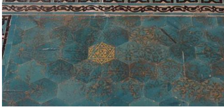
Resim 4: Konya Karatay Medresesi, Düz-Tek Renkli ve Yıldızlı Çiniler.

İslam ve Anadolu Türk çini sanatında en yaygın olan teknik sıraltı tekniğidir. Sıraltına uygulanmış olan ve iç mekânda kullanılan çinilerde iki farklı sırlama yapılmıştır. Birincisinde desen siyah renkle boyanmış ve üzerine turkuaz sırlama yapılmıştır. İkincisinde desenler turkuaz, mor, mavi, siyah renkler ile boyandıktan sonra şeffaf sırla sırlanmıştır (Resim 5), (Öney, 1976; s. 11).