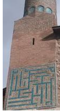
Resim 48: Sivas Çifte Minareli Medrese Detay.