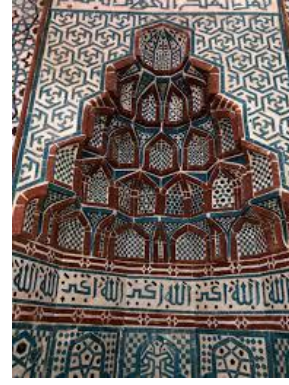
Resim 69: Konya Akşehir Alaaddin Cami, Mihrap. Resim 70: Konya Akşehir Alaaddin Cami, Detayı.

Erzurum Yakutiye Medresesi, İlhanlı Hükümdarı Sultan Olcayto zamanında, Vali Hoca Kemalettin Yakut Gazani tarafından, Gazan Han ve Bulgu Han adına 1310 yılında yaptırmıştır (Karpuz, 2012; s. 228). Medresenin minare kısmında turkuazın göz alıcılığıyla hakim olan bir süsleme bulunmaktadır.