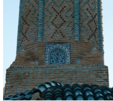
Resim 50: Sivas Gök Medrese, Minare.

Sivas Buruciye Medresesi 1271 yılında II.Gıyaseddin Keyhüsrev tarafından Veziri Hibetullah Burucerdioğlu Muzaffer Bey tarafından yaptırılmıştır (Karpuz, 2012; s. 590). Daha sonra medresenin giriş kapısının sol tarafındaki Selçuklu Veziri Hibetullah Burucerdioğlu Muzaffer Bey ve iki oğlunun medfun bulunduğu türbe yaptırılmıştır. Türbenin içerisinde turkuaz mozaik çinilerle bezenmiş kubbe bulunmaktadır ve restorasyonu beklemektedir (Resim 51).