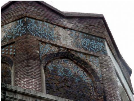
Resim 58: Amasya Gök Medrese.

Amasya Torumtay Türbesi, diğer adı ile Gök Medrese, Amasya Valisi Seyfeddin Torumtay bin Abdullah tarafından 1278 yılında yaptırılmıştır. Yapıda düz turkuaz çiniler ve geometrik desenli çiniler dikkat çeker (Resim 58-59), (Karpuz, 2012; s. 75).