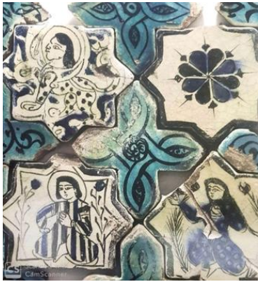
Resim 8: Kubadabad Küçük Saray, Saray,

Özellikle bugün Karatay Medresesi Müzesi'nde sergilenen, Kubadabad büyük ve küçük sarayda uygulanmış olan sıraltı çinilerde turkuaz iki türlü kullanılmıştır. Bazı çinilerde zeminde siyah boyanmış olan desenin üzerine renkli sır olarak uygulanırken, diğer çinilerde de zeminde desenlerde kullanılarak şeffaf sır altına uygulanmıştır (Resim 8-11), (ARIK, 2000; s. 82).