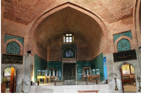
Resim 39: Konya Sahip Ata Cami.