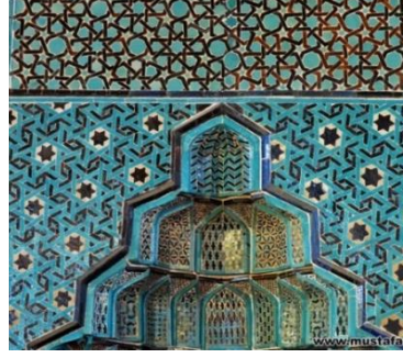
Resim 40-41: Konya Sahip Ata Cami, Detay.