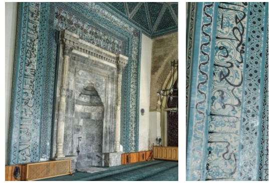
Resim 12: Konya Alâeddin Cami Kubbe, Mozaik Çini.