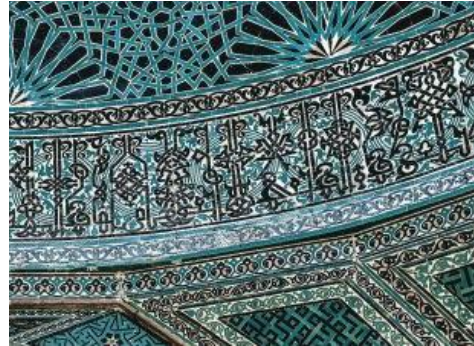
Resim 38: Konya Karatay