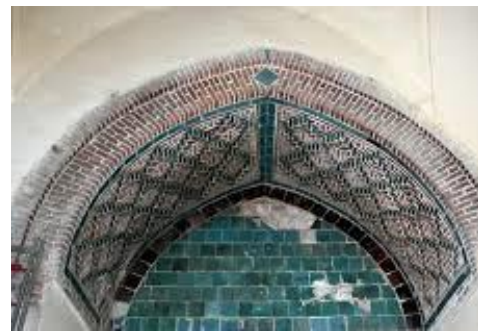
Resim 59: Amasya Gök Medrese, Detay.

Konya Sahip Ata Türbesi, Selçuklu veziri Sahip Ata tarafından kendinden evvel vefat eden iki oğlu için 1283 de yaptırmıştır. İçerisinde 6 adet çini sanduka bulunmaktadır. Turkuaz rengin yoğun kullanıldığı görülmektedir (Resim 60-61), (Karpuz, 2012; s. 424).