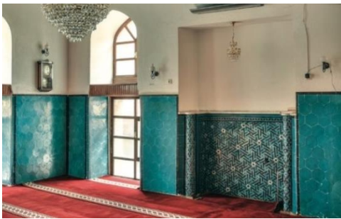
Resim 29: Konya, Bulgur Tekke Mescidi,

Konya, Bulgur Tekke Mescidi yapım tarihi bilinmemekle birlikte çini mozaik tekniği kalıntıları göz önüne alınarak 13. yüzyıl sonuna ve Selçuklu devrine tarihlemek yanlış olmamaktadır (Altun, 1971; s. 53). Mescidin iç kısmında düz çiniler ve geometrik çiniler hâkimdir, Pencere kemer köşelikleri ve alınlıklarına, turkuaz ve lâcivert renkli çini mozaiklerden oluşan geometrik kompozisyonlar islenmiştir (Resim 29-30), (Karpuz, 2012; s. 392).