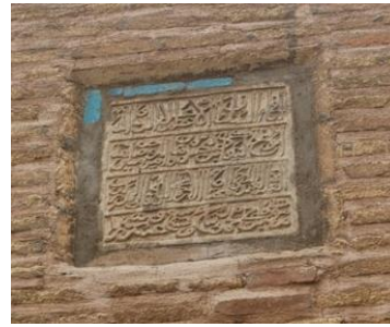
Resim 20: Konya Hatuniye Cami, Yazı Kenarı.

Sivas, Şifaiye Medresesi Sultan I. İzzeddin Keykavus tarafından 1217 yılında yaptırılmıştır. Kendisi 1220 yılında vefat edince buraya defnedilmiştir (Karpuz, 2012; s. 597). Dış cephedeki çini süslemelerinde turkuaz ve kahverengi hâkimdir (Resim 21-22).