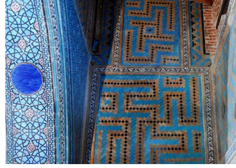
Resim 61: Konya Sahip Ata Türbesi, Detay.

Ankara Aslanhane (Ahi Şerafettin) Cami, Ahi Şerafettin tarafından 13. yüzyıl başında yaptırılmış, 1289–1290 yılları arasında tamir ettirilmiştir. Türbe duvarına gömülü bir antik aslandan dolayı Aslanhane adını almıştır. Camide Mihrap çini mozaik tekniğinde yapılmıştır ve yine turkuazın muhteşem duruşu karşımıza çıkmaktadır (Resim 62-63), (Karpuz, 2012; s. 84).