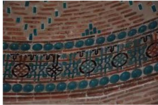
Resim 33: Konya Akşehir Küçük Ayasofya Mescidi, Pencere Alınlığı, Detay.