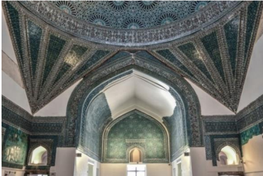
Resim 37: Konya Karatay Medresesi. Medresesi,

Karatay Medresesi, 1251 yılında Sultan II. İzzeddin Keykavus devrinde Emir Celâlettin Karatay tarafından yaptırılmıştır. Mimarı bilinmemektedir. 1955 yılından itibaren “Çini Eserleri Müzesi” olarak hizmet vermektedir. Kubad Abad sarayında bulunan çiniler burada sergilenmektedir. Mozaik çini tekniğinin en muhteşem olanlarını sergileyen bir yapıdır (Karpuz, 2012; s. 405). Kubbesinin alt kısmından tepe kısmına kadar mükemmel bir şekilde düzenlenmiş 24 kollu geometrik motiflerde turkuazın derinliği göze çarpmaktadır Ahmet Hamdi Tanpınar bir yazısında, Karatay Medresesinin “Yüzlerce güneşi ve yıldızı ile küçük bir Kehkeşan gibi parlayan çini tavanı” şeklinde betimlemiştir (Resim 37-38).