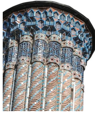
Resim 65: Erzurum Çifte Minareli

Konya Beyşehir Eşrefoğlu, 1299 yılında türbe, kervansaray ve hamam ile birlikte külliye şeklinde, Eşrefoğlu Emir Süleyman Bey tarafından yaptırılmıştır. Selçuklu ahşap camilerinin ve Selçuklu sanat üslubunun izlerini devam etmektedir. Çini mozaik mihrabı, geometrik desenler, turkuaz ile vurgulanarak uygulanmıştır (Resim 66-67), (Karpuz, 2012; s. 84).