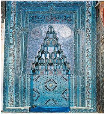
Resim 66: Konya, Beyşehir Eşrefoğlu Cami, Mihrap.

Konya Beyşehir Eşrefoğlu, 1299 yılında türbe, kervansaray ve hamam ile birlikte külliye şeklinde, Eşrefoğlu Emir Süleyman Bey tarafından yaptırılmıştır. Selçuklu ahşap camilerinin ve Selçuklu sanat üslubunun izlerini devam etmektedir. Çini mozaik mihrabı, geometrik desenler, turkuaz ile vurgulanarak uygulanmıştır (Resim 66-67), (Karpuz, 2012; s. 84).