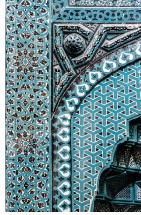
Resim 18: Kayseri Güllük Medresesi, Mihrap, Detay.

Konya Hatuniye Cami, 1213 yılında Ahmet El Arusi'nin kızı Devlet Hatun tarafından yaptırılmıştır. Günümüze minaresinde ve minaredeki yazının çerçevesinde bir miktar turkuaz mozaik çini kalarak gelmiştir (Resim 19-20), (Karpuz, 2012; s. 402).