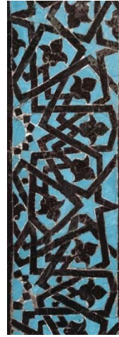
Resim 53: Konya Sahip Ata

Tokat Gök Medrese, 1277 yılında Vezir Muineddin Süleyman Pervane tarafından yaptırılmıştır, Turkuaz ve mavi rengin hâkim olmasından dolayı Gök Medrese denilmiştir (Resim 54-55), (Karpuz, 2012; s. 662).