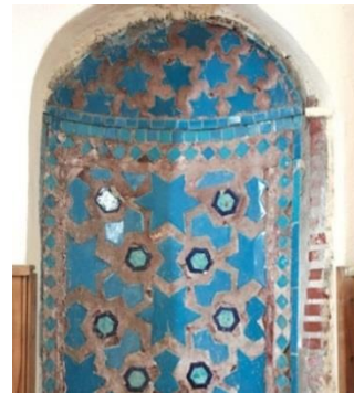
Resim 15: Siirt Ulu Cami Minaresi, Mozaik Çini. Mihrap.