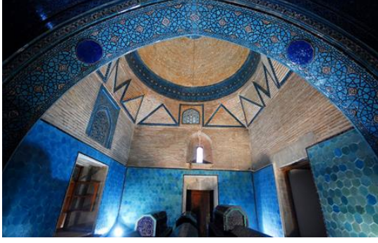
Resim 60: Konya Sahip Ata Türbesi. Detay.