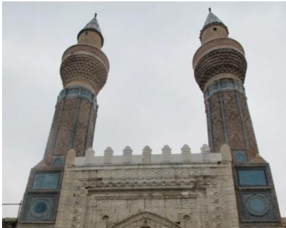
Resim 49: Sivas Gök Medrese Minare.