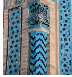
Resim 26: Malatya Ulu

Akşehir Taş Medrese, Sahip Ata Fahreddin Ali tarafından 1250 yılında yaptırılmıştır. Yapıldığı yıllarda çini kaplı olduğu bilinen caminin kubbe içi madalyon, mihrap ve minarede turkuaz çiniye rastlanmaktadır (Resim 27-28), (Karpuz, 2012; s. 443).