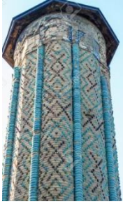
Resim 42: Konya Sahip Ata Cami, Minare.