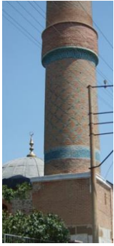
Resim 27: Konya Akşehir Taş Medrese, Minare. Resim 28: Konya Akşehir Taş Medrese, Kubbe İçi.

Akşehir Taş Medrese, Sahip Ata Fahreddin Ali tarafından 1250 yılında yaptırılmıştır. Yapıldığı yıllarda çini kaplı olduğu bilinen caminin kubbe içi madalyon, mihrap ve minarede turkuaz çiniye rastlanmaktadır (Resim 27-28), (Karpuz, 2012; s. 443).