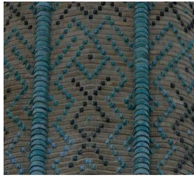
Resim 3: Sivas Gök Medrese Minaresi, Sırsız ve Sırlı Tuğla Bezeme Tekniği.

Anadolu Selçuklu döneminde minarelerde, cami, mescit, medrese duvarlarında, kemerlerde, portallerde, pencerelerde, eyvanlarda mihraplarda, kubbe ve kubbe geçişlerinde, lahitlerde, saraylarda kullanılmış olan turkuaz, bu mimari yapılarda farklı tekniklerde uygulanmıştır. Mimariye özellikle minarelerde sırsız ve sırlı tuğla olarak uygulanan alanlarda, sırlı tuğlada sır rengi olarak en çok turkuaz ve seyrek olarak da mavi ve patlıcan moru renkleri kullanılmıştır. Sırlı tuğla Selçuklu mimarisinde yaygın bir tekniktir ve özellikle turkuazın bakır oksitli firuzeye yakın rengi kullanılmıştır (Resim 3), (Öney, 1976; s. 9).