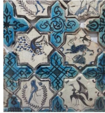
Resim 24: Beyşehir, Kubad Abad