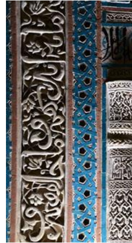
Resim 63: Ankara Aslanhane Cami, Detay.