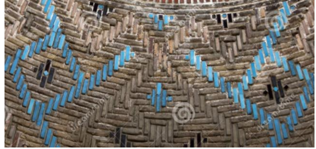
Resim 43: Konya Sahip Ata Cami, Detay.

Akşehir Seyyid Mahmut Hayrani Türbesi, 1268 yılında Seyyid Mahmut Hayrani için yaptırılmıştır. Üzerindeki dilimli külahta turkuaz mozaik çiniler bulunmaktadır (Resim 44-46), (Karpuz, 2012; s. 449).