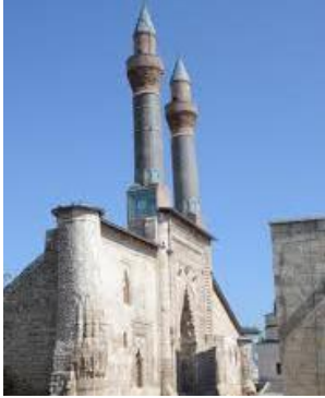
Resim 47: Sivas Çifte Minareli Medrese Detay.

Sivas Çifte Minareli Medrese, 1271 yılında Şemseddin Mehmed Cüveyni tarafından yaptırılmıştır. Günümüze giriş kapısı ve minareleri ulaşmıştır (Karpuz, 2012; s. 586). Minarelerinde Turkuazın hakim olduğu mozaik çiniler görülmektedir (Resim 47-48).