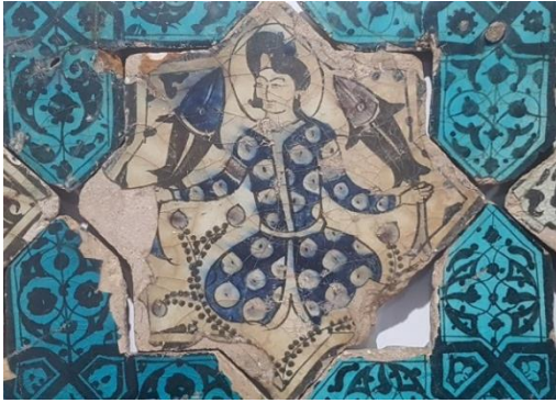
Resim 23: Beyşehir, Kubad Abad Sarayı, Sarayı,

Beyşehir Kubad Abad Sarayı, Sultan I. Alâeddin Keykubad tarafından 1220-1236 yılları arasında yaptırılmıştır. Selçuklunun bilinen en eski sarayıdır (Karpuz, 2012; s. 456). Duvarları, yıldız ve dört kollu çinilerle kaplanmıştır, fakat günümüze kadar gelememiştir. Çinileri yurt içinde Konya Karatay Müzesinde sergilenmektedir (Resim 23-24).