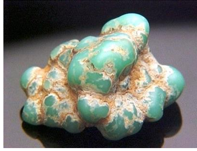
Resim 2: Turkuaz, Yeşile Yakın Firuze Renkli Taş