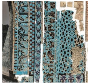
Resim 36: Konya Sırçalı

Karatay Medresesi, 1251 yılında Sultan II. İzzeddin Keykavus devrinde Emir Celâlettin Karatay tarafından yaptırılmıştır. Mimarı bilinmemektedir. 1955 yılından itibaren “Çini Eserleri Müzesi” olarak hizmet vermektedir. Kubad Abad sarayında bulunan çiniler burada sergilenmektedir. Mozaik çini tekniğinin en muhteşem olanlarını sergileyen bir yapıdır (Karpuz, 2012; s. 405). Kubbesinin alt kısmından tepe kısmına kadar mükemmel bir şekilde düzenlenmiş 24 kollu geometrik motiflerde turkuazın derinliği göze çarpmaktadır Ahmet Hamdi Tanpınar bir yazısında, Karatay Medresesinin “Yüzlerce güneşi ve yıldızı ile küçük bir Kehkeşan gibi parlayan çini tavanı” şeklinde betimlemiştir (Resim 37-38).