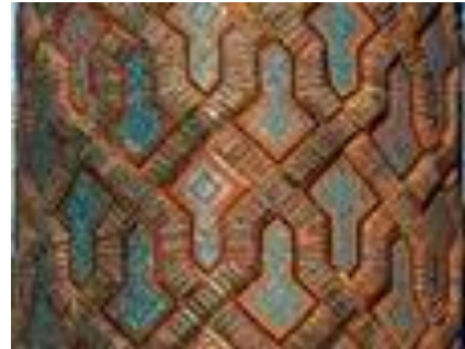
Resim 71: Erzurum Yakutiye Medresesi Minaresi. Resim 72: Erzurum Yakutiye Medresesi Minaresi.