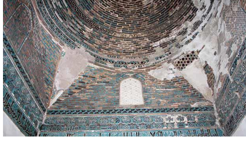
Resim 51: Sivas Muzaffer Burucerdi Türbesi.

Konya Şeyh Sadreddin Konevi Cami, âlim Sadreddin Konevi için 1274-1275 yılları arasında yaptırılmıştır. Banisi ve mimarı bilinmemektedir. İlk yapıldığında içi çini bezemelerle kaplı olan caminin şu an sadece turkuazın yoğun olduğu, bitkisel motifler, geometrik desenler ve yazı ile bezenmiş çini mihrabı kalmıştır (Resim 52-53), (Karpuz, 2012; s. 391).