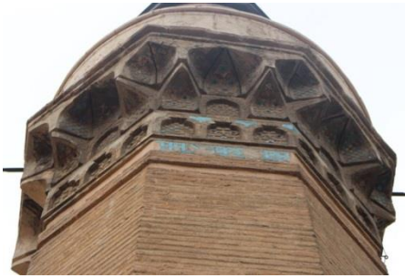
Resim 19: Konya Hatuniye Cami, Minare. Kenarı.

Konya Hatuniye Cami, 1213 yılında Ahmet El Arusi'nin kızı Devlet Hatun tarafından yaptırılmıştır. Günümüze minaresinde ve minaredeki yazının çerçevesinde bir miktar turkuaz mozaik çini kalarak gelmiştir (Resim 19-20), (Karpuz, 2012; s. 402).