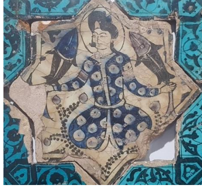
Resim 5: Kubad Abad Sıraltı Tekniğinde Çini.

İslam ve Anadolu Türk çini sanatında en yaygın olan teknik sıraltı tekniğidir. Sıraltına uygulanmış olan ve iç mekânda kullanılan çinilerde iki farklı sırlama yapılmıştır. Birincisinde desen siyah renkle boyanmış ve üzerine turkuaz sırlama yapılmıştır. İkincisinde desenler turkuaz, mor, mavi, siyah renkler ile boyandıktan sonra şeffaf sırla sırlanmıştır (Resim 5), (Öney, 1976; s. 11).