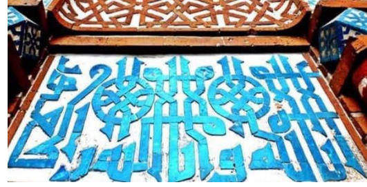
Resim 22: Sivas, İzeddin Keykavus