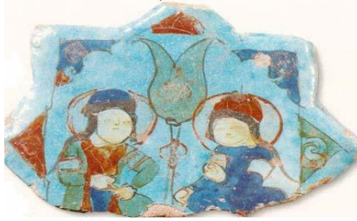
Resim 7: Konya Alâeddin Sarayı, Minai Tekniği Çini.

Yine aynı dönem tekniği olan Konya Alâeddin Sarayında rastladığımız Minai tekniğinde, yedi renk kullanılmıştır. Renklerin bir kısmı sır altına bir kısmı sır üstüne uygulanmıştır (Bakır, 1999; s. 10). Sır altına mor, mavi, yeşil ve turkuaz kullanılırken, şeffaf sırlama yanında nadirde olsa lacivert ve turkuaz sır kullanıldığı da görülmüştür (Resim 7).