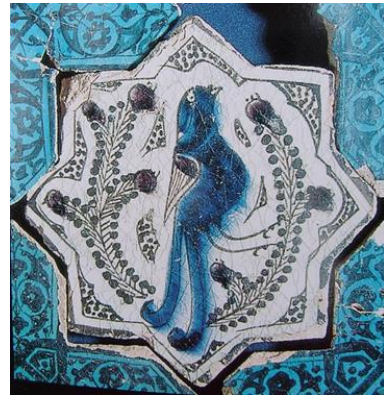
Resim 9: Kubadabad Büyük Saray,

Depo çinileri, Karatay Medresesi Müzesi. Müzesi.