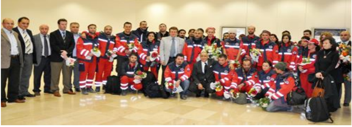
Şekil 2: 2011 Van-Erciş Depremi dönüşü Atatürk Havalimanı, İstanbul İl Sağlık Müdürlüğünün İstanbul UMKE ekibini teşekkür ve çiçeklerle karşıla