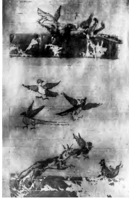
Şekil 4. Smyrna Physiologus Physiologus Kap. 19: Über den Fuchs - Sm. S. 52: Fuchsfabel