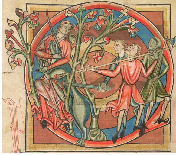
Şekil 2. Harley 4751, f.6v, Unicorn, British Library, London

Antik geleneklere göre Physiologus'da güneşe kör olmadan bakabildiği ve suya üç defa dalıp çıkarak yenilediği açıklanır. Her kültürde olduğu gibi Bizans kültüründe de hayvanlar oldukça önemli olmuştur. Bizans sanatında kartallar tanrının gücünü temsil edip Ortaçağ'da imparatorluk sembolü olmuşlardır. Hristiyan ikonografisinde kartal aynı zamanda İncil yazarı Yahya'yı sembolize etmektedir. İncil yazarı Markos'un sembolü ise aslandır ve Bizans ikonografisinde bu başka bir önemli hayvandır. Erken çağlarda aslan kötü güçleri olan şeytani temsil edip kirlilik sembolüydü. Ortaçağda ise aslan imparatorluk sembolü olmuştur” ( http://bestiary.ca ).