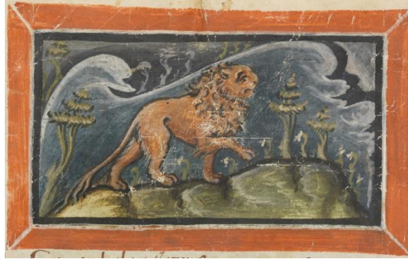
Şekil 1. Physiologus Bernensis, Cod. 318 – f. 7v, Burgerbibliothek, Bern

Bibliothek van België'de bulunan, 10. yüzyıla tarihlenen, 10074 numaralı örnek için kullanılır. A grubuna ait olan Physiologus'un Brüksel kopyası çok önemlidir çünkü içindeki zarif Karolenj dönemi minyatürler metni açıklamaktadır. İkinci grubu oluşturan B kopyası ise içinde minyatürleri olmayan, İngilizce ve Fransızca gibi Latin dillerindeki Physiologusların türetildiği, 8. ya da 9. yüzyıla tarihlenen Bern Burgerbibliothek'de Lat. 233 numarasıyla kayıtlı olan örneği belirtir. Üçüncü grubu oluşturan C kopyası 9. Yüzyıla tarihlenen Yunancasının sözdizimi ve anlamsal olarak eksik ve yanlış olan yine Bern Burgerbibliothek'de, Lat.318 numarasıyla kayıtlı bulunan Physiologus'tur. Dördüncü grubu oluşturan Y kopyası ise, aslen Yunanca olup günümüze ulaşamamıştır. Bunun yerine Latince çevirisi kullanılmıştır. Diğer versiyonlar üzerinde çok az etkisi bulunur. 8. veya 9.yüzyıla tarihlenir, Bern Burgerbibliothek'de, Lat. 611 kayıt numarasıyla gösterilir. Y versiyonunun Bern kopyası en eski resimli minyatürleri içermektedir " (Curley, 2009:5) . Araştırmamızda çeşitli Physiologus örneklerine ait olabildiğince net görünen farklı minyatürler ve hayvanlar ilginç bir görüntü sunmalarıyla nedeniyle seçilmiştir.