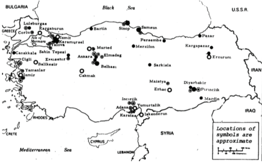
Ek-2: Türkiye'deki ABD Üs ve Tesislerinin Haritası (1980) 106