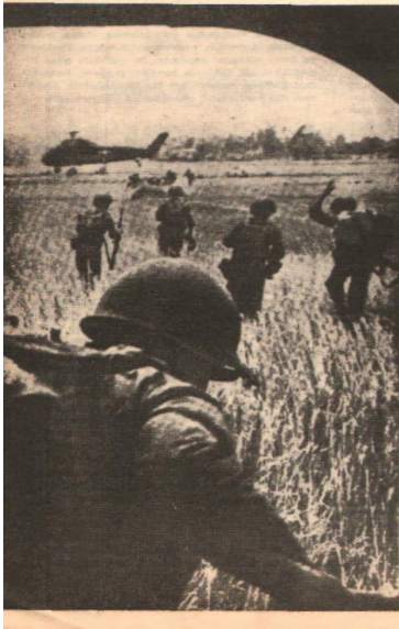
Türk topraklarında Amerikan askerleri, Türk yöneticilerini haberi olmadan her istisnalarla süpürdüler