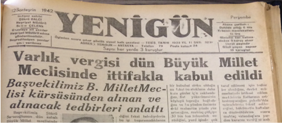
Ek-1: Yenigün Gazetesi Örnekleri (12.11.1942 – 15.12.1942 – 17.12.1942)