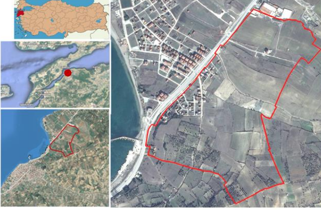
Şekil 1. Antik Lampsakos (Lapseki) Kentinin ve Kuzey Nekropol (Üçüncü Derece Arkeolojik Sit) Alanının Konumu (KAİP, 2019)