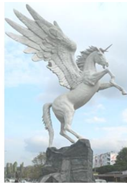
1-c) Pegasos heykeli İskele Meydanı (URL-3)