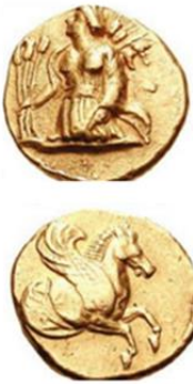
1-a) M.Ö. 370 tarihli altın sikke

Antik Çağda kentlerin bağımsızlığını ve sosyo-ekonomik düzeyini simgeleyen sikke darbı, Troas bölgesinde M.Ö. 6. yüzyılda kendi adına ilk sikke basan kent olarak Lampsakos'a aittir. M.Ö. 500'lere kadar elektron, daha sonra altın ve gümüşten olan bu sikkelerinin basımına Roma İmparatoru Gallienus (218-268) dönemine kadar devam edilmiştir (Arslan, 2007). Lampsakos'un erken dönem sikkelerinde Pegasos, Athena, Apollon betimlemeleri yer alır. M.Ö. 4. yüzyıl sikkelerinde Zeus, Demeter ve Pers satraplarının portreleri gibi çeşitli betimlemeler bulunmaktadır. M.Ö.370 tarihli Lampsakos'un altın sikkesinin (8.35 gr.) ön yüzündeki pelerin giysili hububat ve bereket tanrıçası Demeter ve üç başaklı tahıl, sol omuz üzerinde iki başak, asma dalı ve üzüm salkımı figürleri, kentin tarıma dayalı zenginliğini, arka yüzündeki Pegasos (Kanatlı At) deniz ticaretindeki hâkimiyetinin göstergesidir (Asia Minor coins, 2011). Bu sikkedeki Pegasos figürü (Foto 1-a) dünyada ilk defa adına para basılan kent olan Lapseki kentinin simgesi olarak Gazi Mustafa Kemal Atatürk Meydanındaki anıt (Foto 1-b) ve 2012'de İskele Meydanına dikilen heykel (Foto 1-c) gibi çeşitli alanlarda ifade edilmektedir.