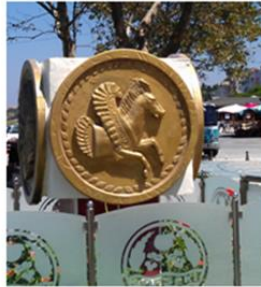
1-b) Pegasos Anıtı Gazi Mustafa Kemal Atatürk Meydanı