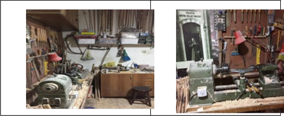
Görsel 5-6. Baston Yapımında Kullanılan Araçlar

Devrek bastonunun karşı karşıya kaldığı en mühim sorun baston sanatını ilerletebilecek çırakların yetişemiyor olması olarak belirtilmektedir. Devrekli ustalar bastonculuğun artık eskisi kadar değer görmediğini ve önceden insanların gerçek ustalara baston yaptırdıklarını; şimdi ise mesleği bilen bilmeyen herkesin usta olduğunu belirtmekte; usta-çırak ilişkisinin tamamen kaybolmaya yüz tutmaya başladığını ve bu mesleğin yok olup gitmesinden korktuklarını dile getirmektedirler (Teke vd. 2018, 98). Teke ve arkadaşlarının çalışmasında vurgulandığı gibi mesleğin devamını sağlayabilmek için yeni çırakların yetişmesi gerekmektedir. Bastonculuk mesleğinin asıl sorunu eğitim hataları ve zanaatkar sorunudur. Böylece eski ustaların baston yapım yöntem ve tekniklerini iyi bilen sanatkârlara ihtiyaç duyulduğuna vurgu yapmak önemlidir.