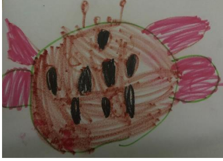
Şekil 1: Ç112'nin uğurböceği çizimi

Katılımcı çocukların “öğretmen” kavramına ilişkin örnek çizimlerine aşağıda yer verilmiştir: