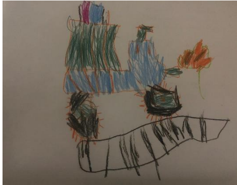
Şekil 3: Ç67'nin 'tren' çizimi