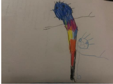
Şekil 3: Ç8'in 'gökkuşuğu' çizimi