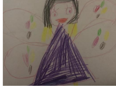
Şekil 4: Ç3'ün 'kelebek' çizimi