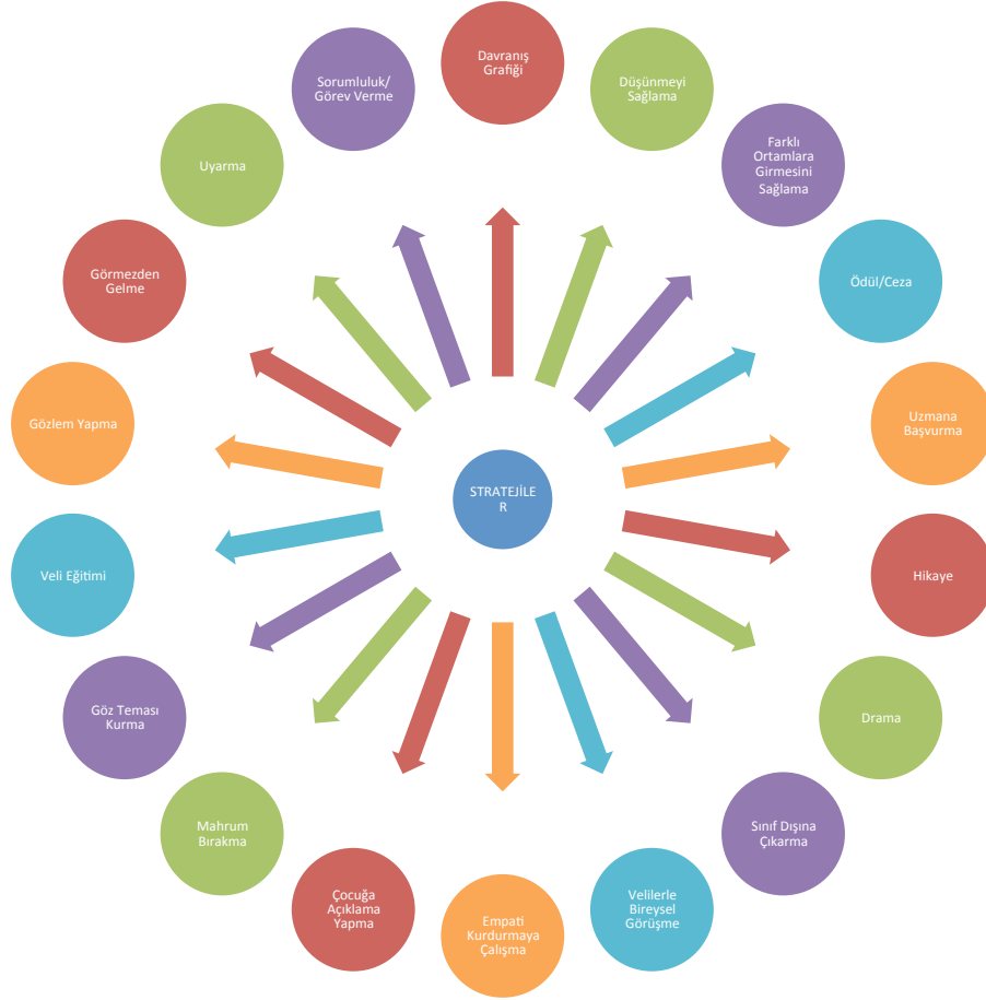
Şekil 3. Davranış problemlerine yönelik uygulanan stratejiler

Ö-1; ...Bununla ilgili birçok yöntem var tabi... Kendi adıma konuşacak olursam, sakin kalmaya çalışıp durum analizi yapmaya çalışıyorum. Her zaman yapabiliyor muyum bunu, tabi ki hayır. Zaman zaman benim de anlık tepki verdiğim oluyor. Ya da mahrum bırakma gibi yöntemler kullandığım oluyor. Şöyle bir şey de var; teori ile pratik birbirinden çok farklı. Davranış problemi olan bir çocuğa, bir strateji uygulanacaksa bu bütüncül olmalı. Aile ile sıkı bir diyalog hali olmalı... Aile ve rehberlik servisimizle görüşmeleri başlatıp, sorunun kaynağını araştırıyorum. Çocuğun temelde neyin yoksunluğuna girdiğini tespit etmeye çalışıyoruz. Sonrasında aile ile işbirliği içinde gerekeni yapmaya çalışıyoruz. Çocuğu yargılayarak değil, yol göstererek ilerlemeye çalışıyoruz. Otorite olduğu için doğru davranışı yapmasını istemiyoruz. Doğru-yanlış ayrımı yaparak, öz denetimini kazanarak ilerlemesini sağlamaya çalışıyoruz. Kriz anında onu yargılamak yerine, duygularını anlıyorum fakat bunları bu şekilde değil de şu şekilde ifade etmeye çalışmalısın, gibi diyaloglarla doğru davranışa yönlendirmeye çalışıyorum. Ve son olarak öğrencilerimi gerçekten çok seviyorum. Bunu bir strateji olarak söyleyebilir miyiz bilmiyorum ama sevginin gücü her şeyin üstünde diye düşünüyorum.