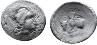
Fig. 5 Kat. No. 5; Arykanda Kazıları.