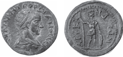
Fig. 31 AE, İmp. III. Gordianus, MS 242-244, Arykanda Darphanesi, 9.41g.; Kölner Münzkabinett Tyll Kroha Nachfolger UG, Auc. 107, lot 268, 07.10.2017.