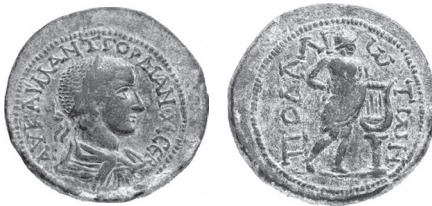
Fig. 17 Kat. No. 11; Gorny & Mosch Giessener Münzhandlung, Auc. 176, lot 1707, 10.03.2009.