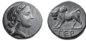
Fig. 14 AE, MÖ. 2. Yy., Termessos Major Darphanesi, 2.51g., Dr. Busso Peus Nachfolger, Auc. 407/8, lot 851, 07.11.2012.