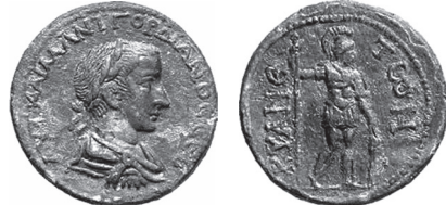
Fig. 32 AE, İmp. III. Gordianus, MS 242-244, Kyaneai Darphanesi, 9.41g.; Gorny & Mosch Giessener Münzhandlung, Auc. 147, lot 1846, 07.03.2006.