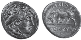
Fig. 9 AE, Kral I. Seleukos, MÖ 282/281, Magnesia ad Maeandrum Darphanesi, 2.26g., American Numismatic Society (env. 1941.131.1086)