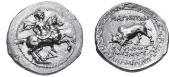
Fig. 10 AR, MÖ 150-140, Magnesia ad Maeandrum Darphanesi, 5.66g., Classical Numismatic Group, Inc., Auc. Triton XXII, lot 249, 08.01.2019.