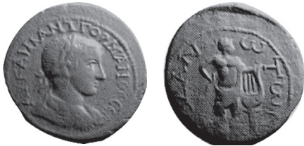
Fig. 15 Kat. No. 9; SNG Righetti, no. 1241, lev. 84.