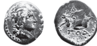
Fig. 8 Kat. No. 8; SNG Greece 7, no. 958, lev. 93.