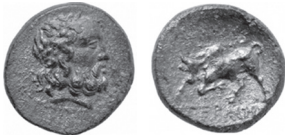
Fig. 13 AE, MÖ. 2. Yy., Termessos Major Darphanesi, 2.84g., Numismatik Naumann, Auc. 53, lot 351, 07.05.2017.