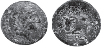
Fig. 1 Kat. No. 1; Smithsonian, National Numismatic Collection.