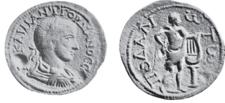
Fig. 20 Kat. No. 13; "von Aulock 1974, no. 282, lev. 15.