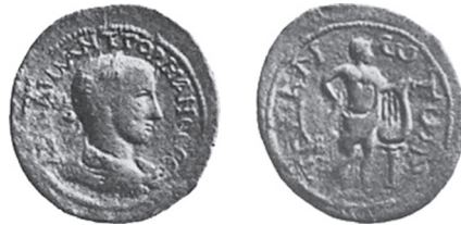
Fig. 16 Kat. No. 10; SNG v. Aul, Lykien, no. 4448, lev. 145.