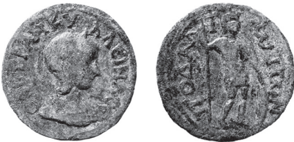
Fig. 25 Kat. No. 18; Arykanda Kazıları.