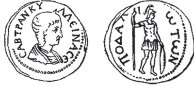
Fig. 28 Kat. No. 21; Eckhel 1775, lev. XIII, fig. 2.