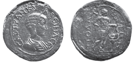
Fig. 22 Kat. No. 15; P. &amp; P. Santamaria Auc. Signorelli Parte III, lot 1060, lev. XX, 1953.