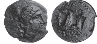
Fig. 4 Kat. No. 4; Münzen und Medaillen AG., Auc. 13, lot 215, 07/08.09.1997.