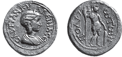
Fig. 24 Kat. No. 17; Numismatik Lanz München, Auc. 117, lot 1078, 24.11.2003.