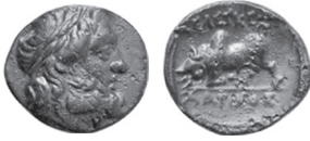
Fig. 11 AE, MÖ 3. Yy. Seleukia/Tralleis Darphanesi, 2.15g., Numismatik Naumann, Auc. 52, lot 1328, 02.04.2017.