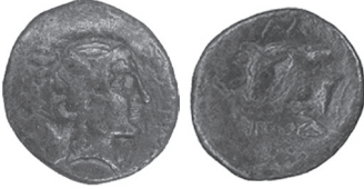
Fig. 3 Kat. No. 3; Yale Art Gallery.