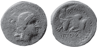
Fig. 7 Kat. No. 7; Svoronos 1903, lev. XI.25.