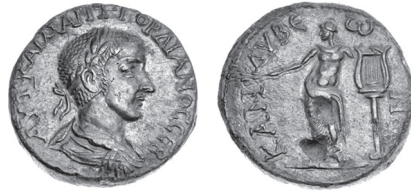
Fig. 30 AE, İmp. III. Gordianus, MS 242-244, Kandyba Darphanesi, 22.73g.; Classical Numismatic Group, Inc., Auc. Triton XVI, lot 708, 08.01.2013.