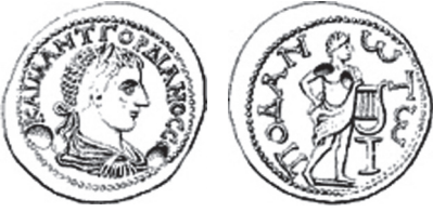
Fig. 19 Kat. No. 13; Fox 1862, no. 115, lev. 6.