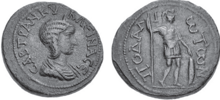
Fig. 23 Kat. No. 16; Classical Numismatic Group, Inc., Auc. 88, lot 916, 14.09.2011.