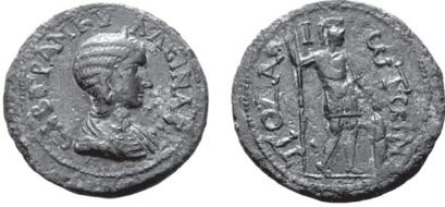
Fig. 27 Kat. No. 20; Roma Numismatics Ltd., E-Sale 8, lot 445, 31.05.2014.