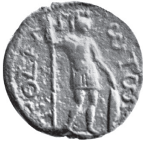
Fig. 21 Kat. No. 14; von Aulock 1974, no. 284, lev. 15.