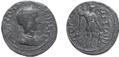
Fig. 29 Kat. No. 21; Floransa, Museo Archeologico Nazionale.