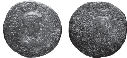
Fig. 26 Kat. No. 19; Cabinet Medailles.