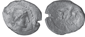
Fig. 2 Kat. No. 2; British Museum.