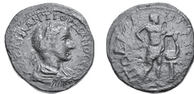
Fig. 18 Kat. No. 12; Classical Numismatic Group, Inc., Auc. 85, lot 590, 15.09.2010.