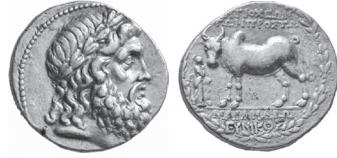
Fig. 12 AR, MÖ 85-80, Antiokhia ad Maeandrum Darphanesi, 16.29g., Leu Numismatik, Auc. 4, lot 280, 25.05.2019.