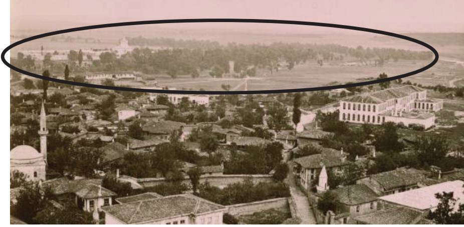
Res. 1: Edirne Sarayı, 1877-78 Osmanlı Rus Savaşı sırasında Dmitri İvanoviç Ermakov tarafından çekilen fotoğraf. (Özer, 2017, 86.)

ve bostancıbaşı vaz olunmaya ve devletten sefer olmadıkça Edirne'de kimse oturmaya " diyerek yemin etmiştir. 5 Bu bağlamda Edirne Sarayı III. Ahmed'in bu yemininden dolayı uzun bir süre terkedilmiş ve eski görkemli günlerinden uzak bir süreç yaşamıştır. Ancak III. Mustafa tahta çıktığından kısa bir süre sonra, atalarının Edirne'de gerek seferler gerekse de avlanma "bahanesiyle" bulduklarını, lâkin Sultan III. Ahmed'ten beri sarayın kullanılmamasından dolayı sarayın itibarının düştüğünü, bir sükût dönemi yaşadığını ve harabe haline geldiğini ifade etmiştir. Dahası Sultan, sarayın böyle " harab-zâr " kalmasının kabul edilemeyeceğini, bu durumun devletin şanına halel getirdiğini belirterek, bir an evvel tamir edilmesini emretmiştir. 6