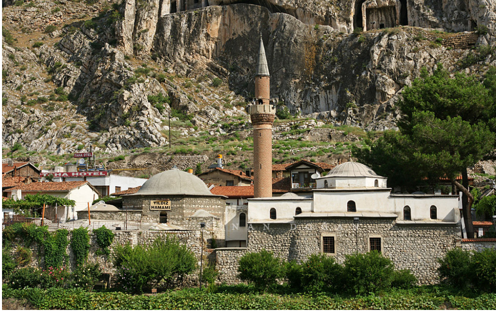
Resim 2. Amasya Bülbül Hatun Külliyesi