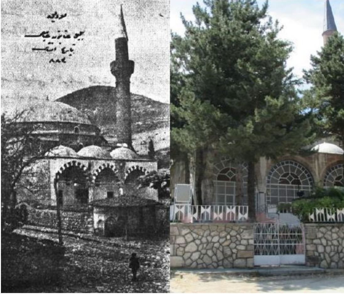
Resim 1. Lâdik Bülbül Hatun Camii (1943 Depremi Öncesi ve Sonrası)