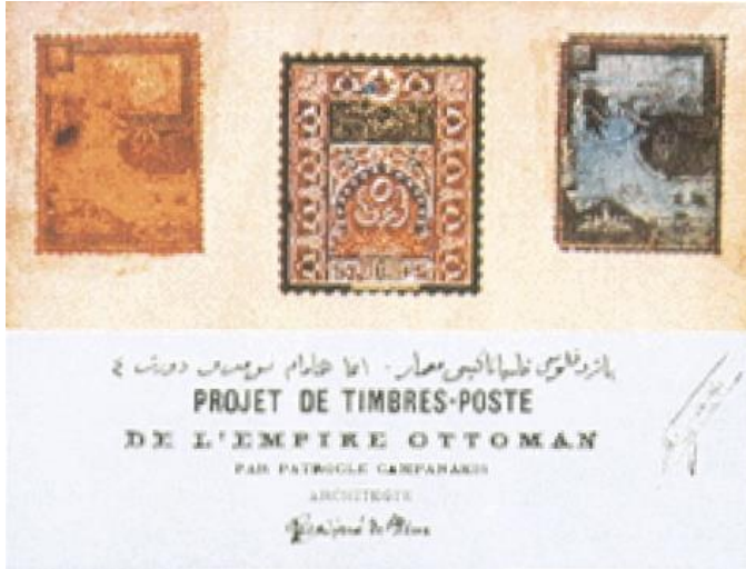
Ek 1: Osmanlı Devleti'nin bastırıldığı olimpiyat pulları (Bergman, 1996).

Ancak bu paraya rağmen atış alanı, bisiklet parkuru ve deniz sporları için gerekli olan iskele ve kayıkanelere bütçe kalmamıştı. Filateli bu esnada imdada yetişti. Olimpiyat oyunları hatırası olarak satışa çıkarılan pullardan 200.000 Drahmi gelir elde edildi (Bergman, 1996).