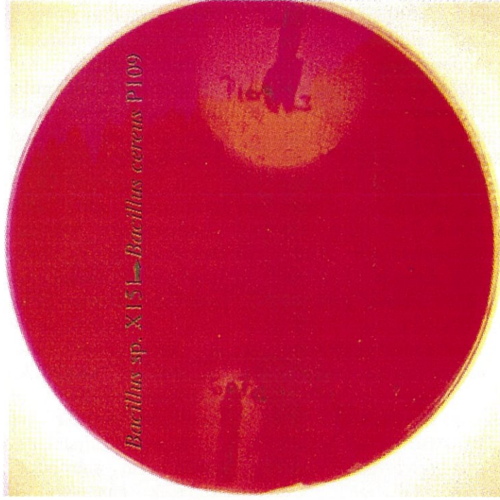
Şekil 2. Protoplast transformasyon sonuçları ( Bacillus sp X151'den Bacillus cereus P109'a).