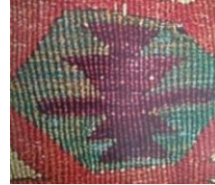
Fotoğraf: 18, Konya kilimi (Erbek 1997: 60). Fotoğraf: 19, Konya kilimi (Erbek 1997: 78). Fotoğraf: 20, Konya kilimi (Erbek 1997: 57).

Ulusal Müze'deki dokumada yer alan yıldız yanışlarının aynı formu Balıkesir, Eskişehir ve Konya kilimlerinde de vardır.