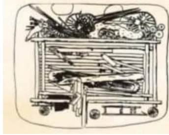
Şekil: 1, Pazırık Korigani'nda eşyaların yerleşme düzeni (Huseynov 2016: 13).

Sergey Ivanoviç Rudenko'nun açtığı Pazırık kurganlarındaki kalıntılarda bulunan ve Leningrad Hermitage Müzesi'nde muhafaza edilen, eşyalarda İskit sanatı izleri görülmektedir (Diyarbakirli 1969: 156).