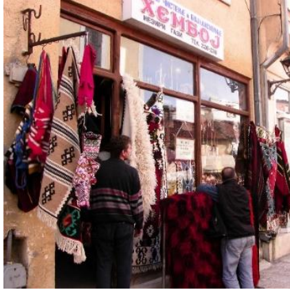
Fotoğraf: 6, K. Makedonya Üsküp'te yanbol ve diğer dokumaların satıldığı bir dükkân.

Günümüzde neredeyse yanbol dokuyan tezgâh da kalmamıştır. Ancak geçmişte Balkanların pek çok bölgesinde yanbol dokunmuştur. Mekikli dokuma tezgâhında yapılan yanbol için atkı ipliği yünden iğ ve öreke ile kalınlığa göre eğrilerek hazırlanır.