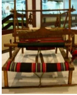
Fotoğraf: 3, Ulusal Müze’de sergilenen bir mekikli dokuma tezgâhı (A. Aytaç arşivi).

Ayrıca, Makedonya tarihine ışık tutan bazı eserler ve eski kiliselerden toplanan malzemelerde sergilenir.