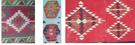
Fotoğraf: 14, Konya kilimi (A. Aytaç arşivi). Fotoğraf: 15, Konya kilimi (Erbek 1997: 74). Fotoğraf: 16, Konya-Karapınar kilimi (A. Aytaç arşivi).

bölümünde bıçkırılı bir madalyon vardır. Lacivert renkli suda dikimler nakızsızdır. Yatım sularda ise yan yana yıldız yanışları sıralanmıştır.