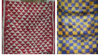
Fotoğraf: 22, Konya-İlgın Çiğil dokuması (A. Aytaç arşivi) Fotoğraf: 23, Konya-Karapınar tülüsü (A. Aytaç arşivi).

Ulusal Müze'de bulunan yanbolun tüm yüzeyi üçgen şeklinde bir bezeme ile raport şeklide kaplanmıştır. Konya Karapınar yöresi tülülerinde de benzer şekilde geometrik düzende raport desen şemalarına rastlanır.