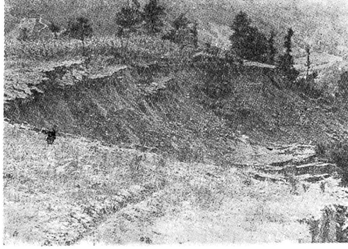
Mudurnu Suyu Vadisinde bir Heyelan

yerlerde çok ağır formasyon hareketleri olmaktadır. Bunlara heyelan demek zordur (Mudurnunun Taşkesti köyü civarı) bu hareketler daha ziyade depremle ilgilidir. Bundan başka Pötürgenin kuzeyinde, Eosen kristalen, serpantin kantağında, Zara-İmranlı civarında Oligo Miosen Jipsli seri ile volkanik Eosen kantağında, Babadağ karasal Neojen ile kristalin kantağında, ve Sarıoğlanın kuzey batısındaki Oligo Miosen jipsli seri ile karasal Neojen kantağındaki faylar civarında heyelanlar olmaktadır. Batı Anadoludaki depremler aktif grabenlere bağılıdır. Bu bölgedeki kayma